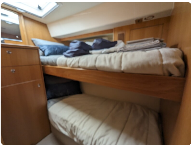
Riviera 45 Fly pullman berth cabin