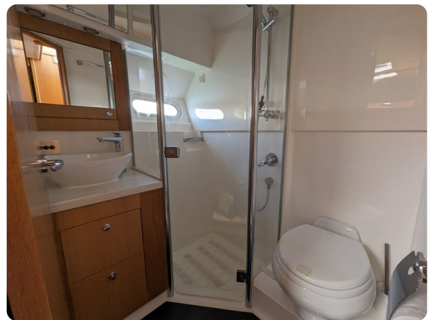
Riviera 45 Fly guest bathroom