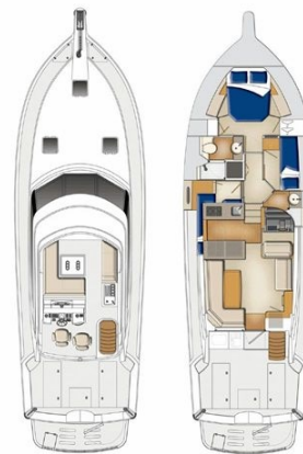
Riviera 45 Fly layout