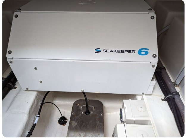
Riviera 45 Fly Seakeeper