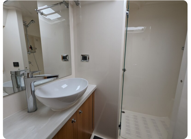
Riviera 45 Fly owner's bathroom