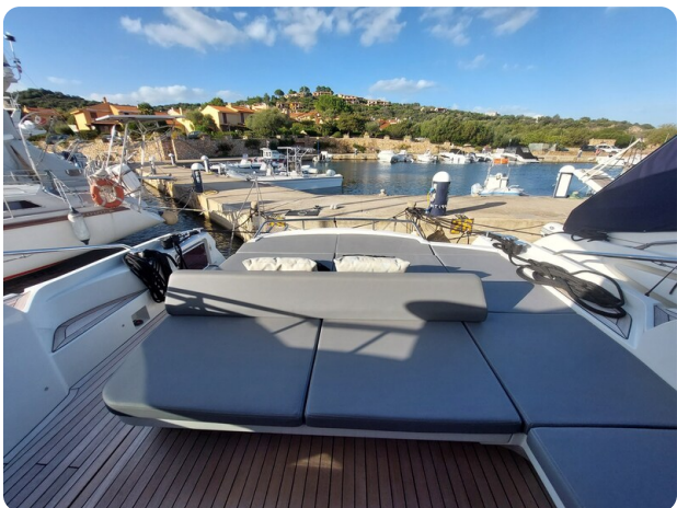
Rizzardi IN five Fiftyfive.jpg