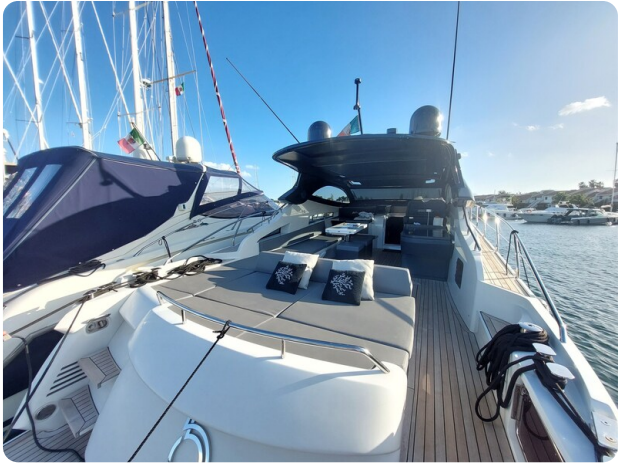
2Rizzardi IN five Fiftyfive.jpg