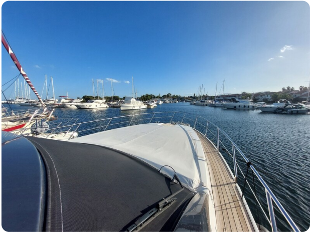
Rizzardi IN five Fiftyfive.jpg