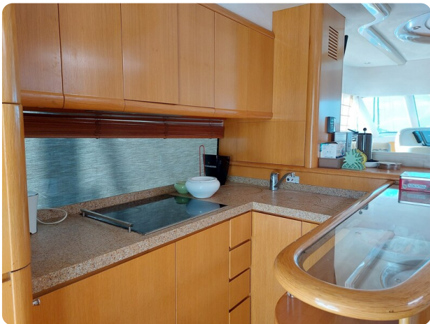
Rodman Yacht 64 Belisa, cucina