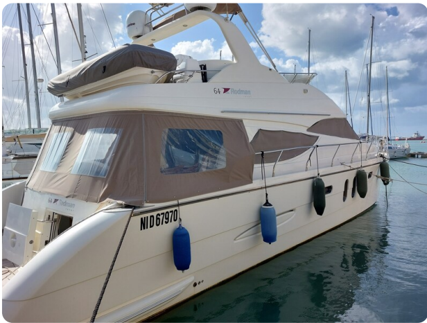
Rodman Yacht 64 Belisa, profile 3