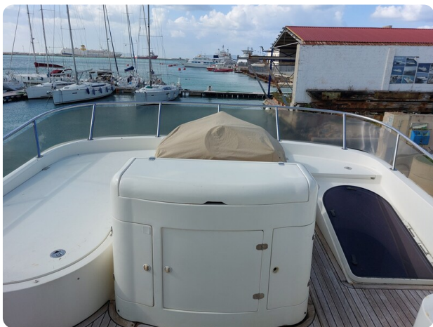
Rodman Yacht 64 Belisa, fly 1