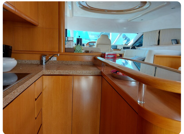
Rodman Yacht 64 Belisa, interno cucina