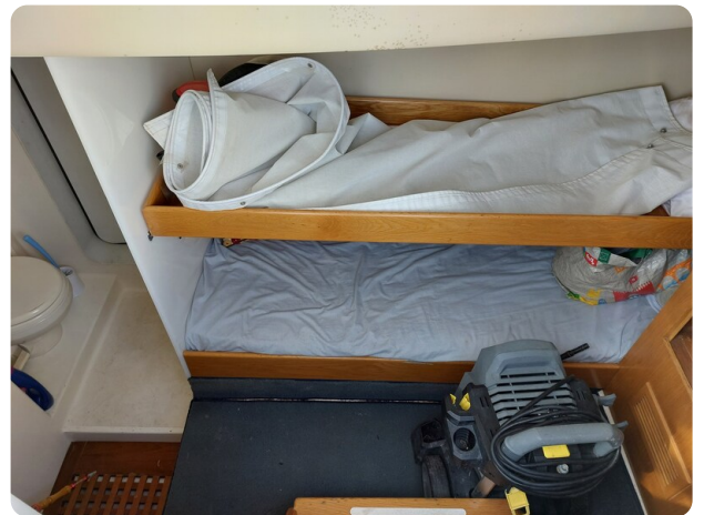
Rodman Yacht 64 Belisa, cabina crew