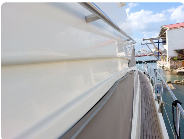
Rodman Yacht 64 Belisa, passaggio laterale