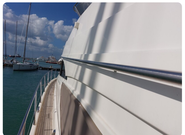
Rodman Yacht 64 Belisa, profilo dettaglio