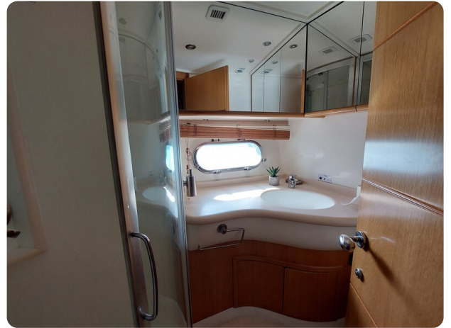
Rodman Yacht 64 Belisa, cabina vip bagno