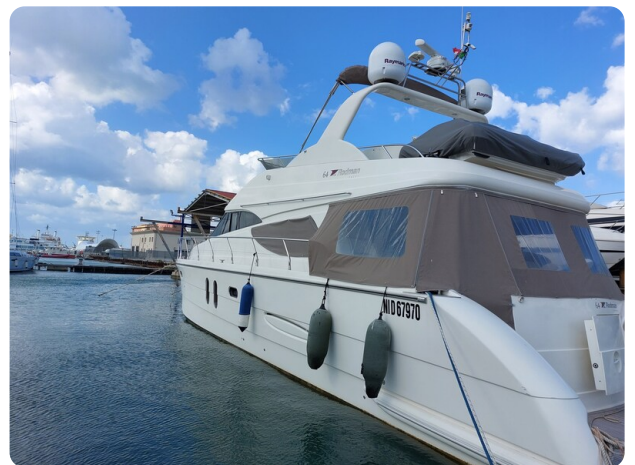
Rodman Yacht 64 Belisa, profile2