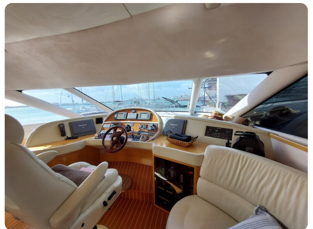
Rodman Yacht 64 Belisa, plancia comandi interno