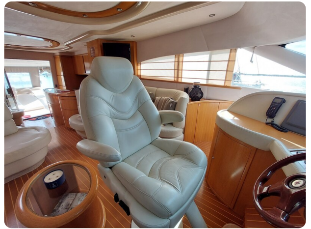
Rodman Yacht 64 Belisa, guida 3