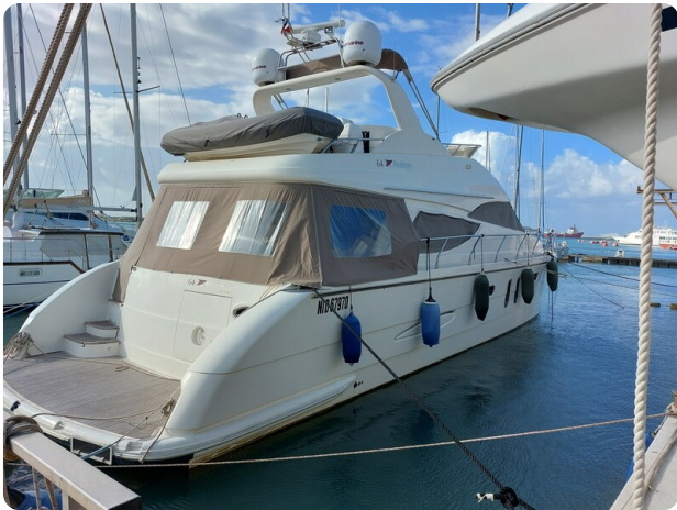
Rodman Yacht 64 Belisa, profile