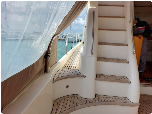
Rodman Yacht 64 Belisa, dettaglio scala fly