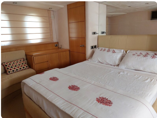
Rodman Yacht 64 Belisa, cabina armatoriale