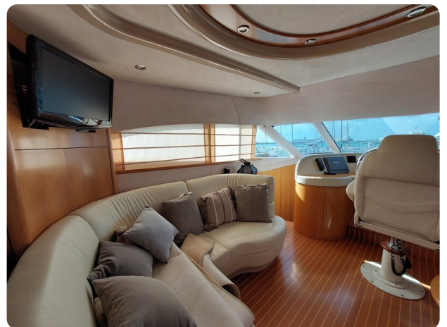
Rodman Yacht 64 Belisa, divano