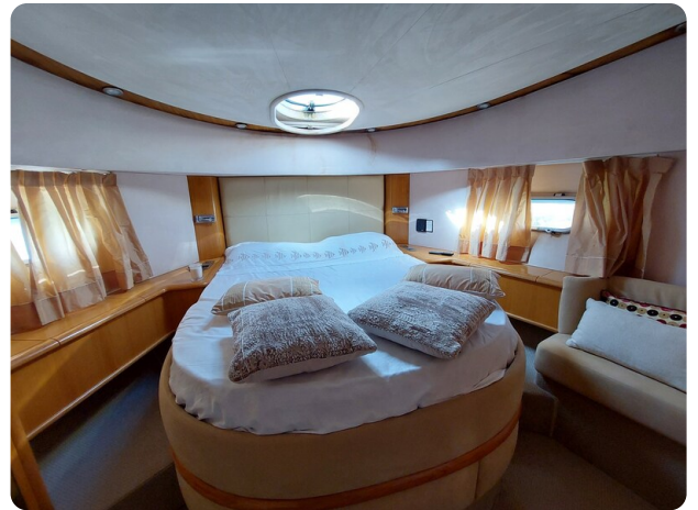
Rodman Yacht 64 Belisa, cabina vip