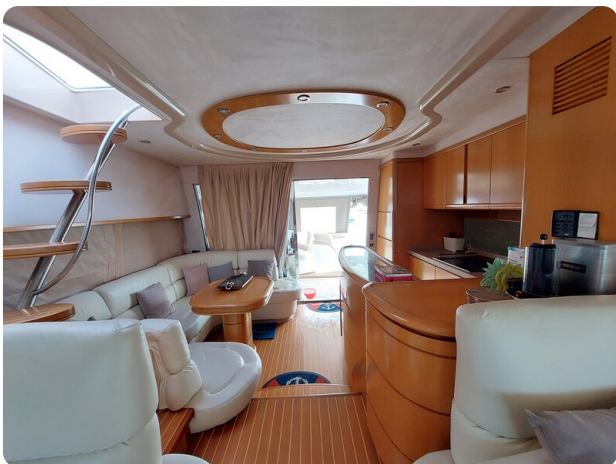
Rodman Yacht 64 Belisa, interno 1