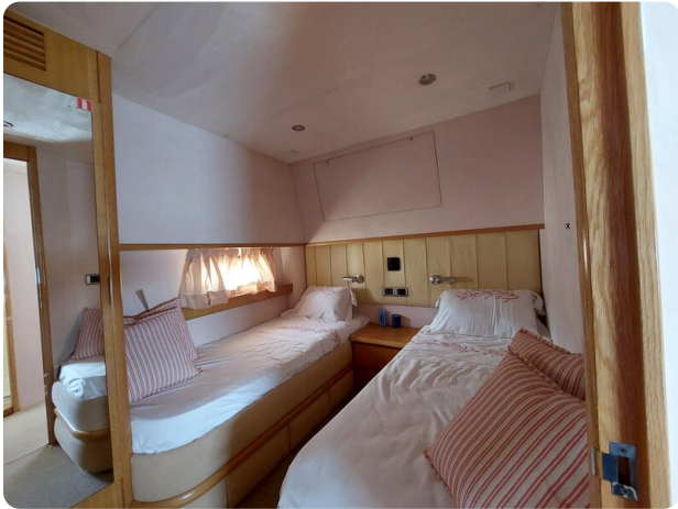
Rodman Yacht 64 Belisa, cabina twin