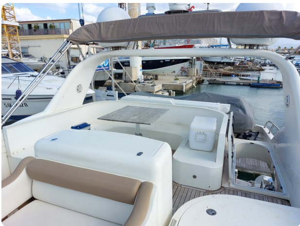
Rodman Yacht 64 Belisa, fly