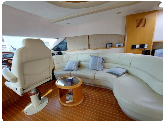
Rodman Yacht 64 Belisa, salone e guida