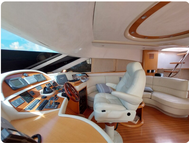
Rodman Yacht 64 Belisa, interno guida e salone