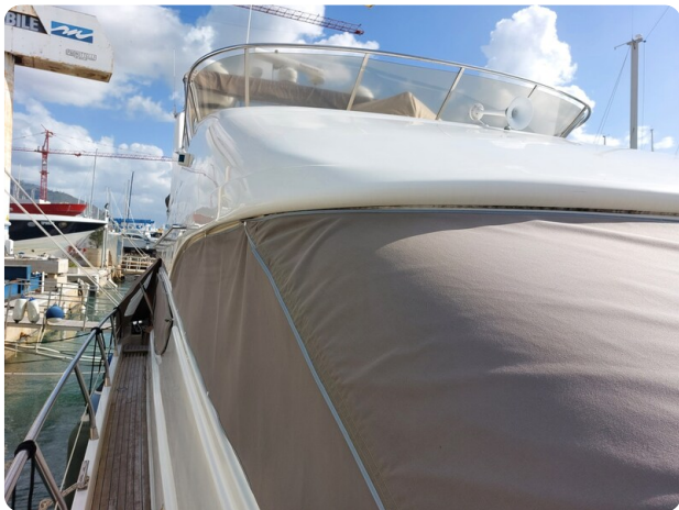
Rodman Yacht 64 Belisa, telo copri finestra dettaglio