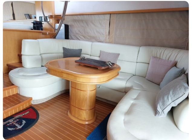
Rodman Yacht 64 Belisa, salone