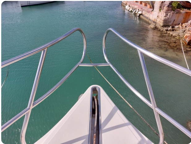
Rodman Yacht 64 Belisa, prua dettaglio