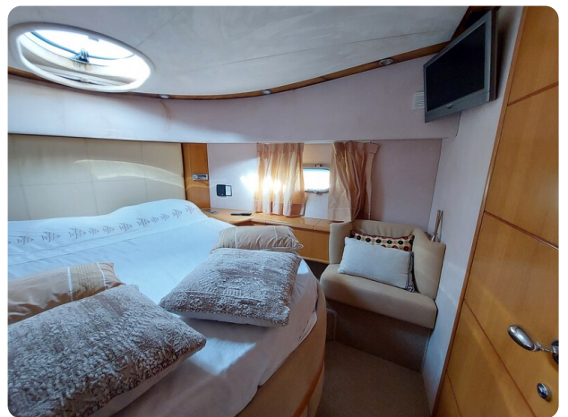
Rodman Yacht 64 Belisa cabina vip dettaglio