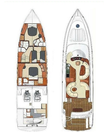
Rodman 64, Belisa, layout