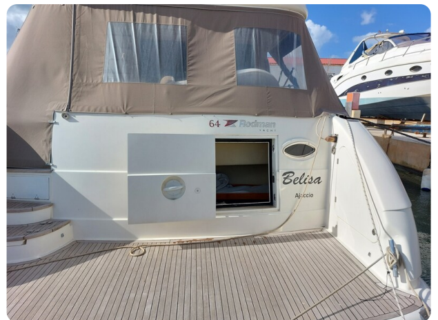
Rodman Yacht 64 Belisa, plancetta di poppa