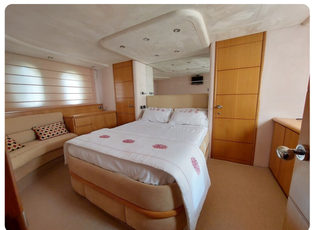
Rodman Yacht 64 Belisa, cabina armatorile 1