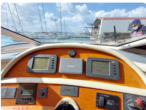
Rodman Yacht 64 Belisa, strumenti 1