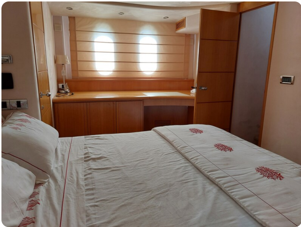
Rodman Yacht 64 Belisa, cabina armatoriale oblò