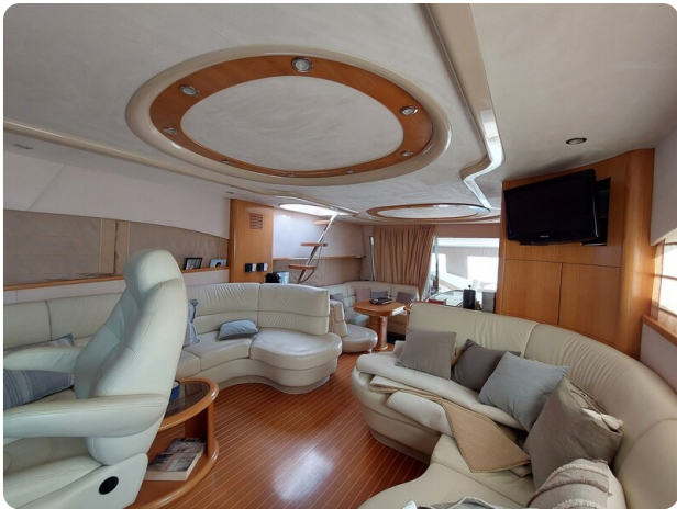
Rodman Yacht 64 Belisa, interno guida e salone1