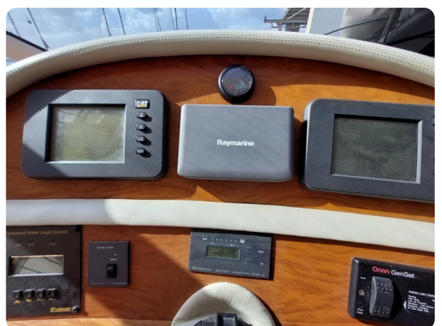
Rodman Yacht 64 Belisa, strumenti