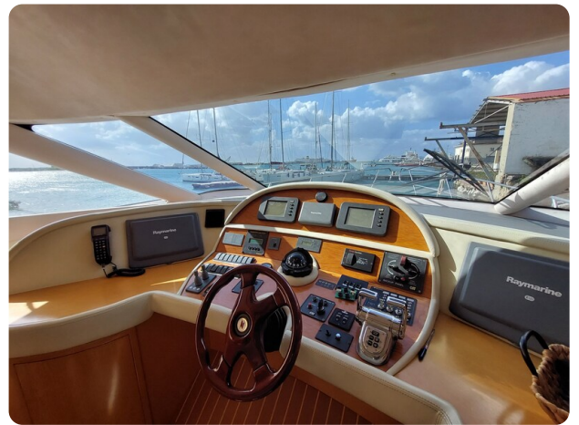
Rodman Yacht 64 Belisa, plancia comandi interno1