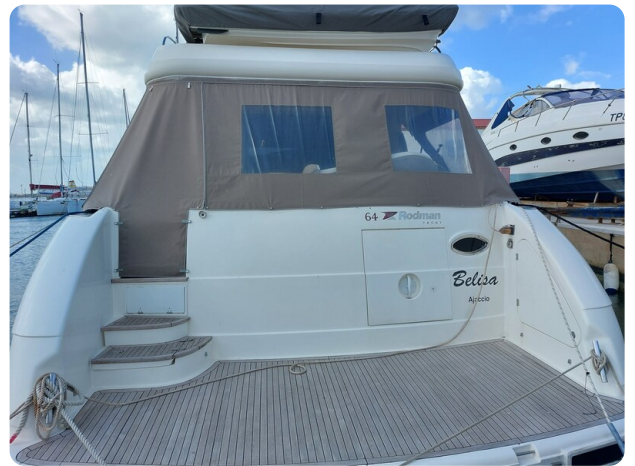
Rodman Yacht 64 Belisa, tendalino copri pozzetto