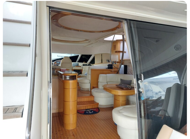
Rodman Yacht 64 Belisa, porta d'ingresso