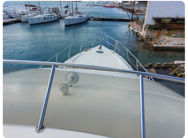
Rodman Yacht 64 Belisa, prua vista dal fly