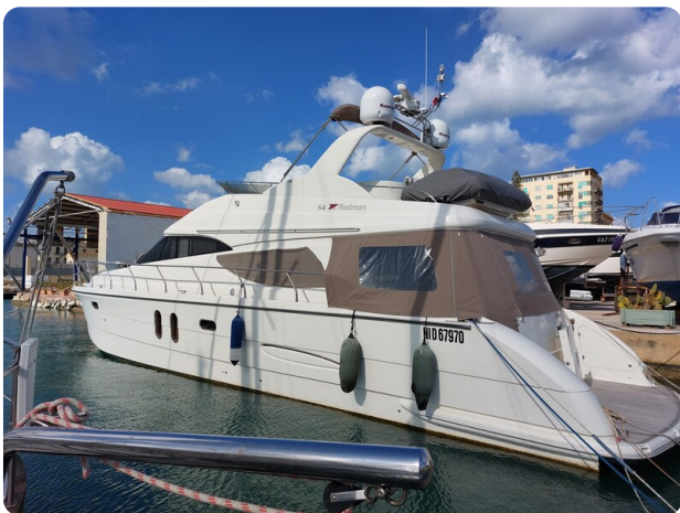
Rodman Yacht 64 Belisa, profile 1