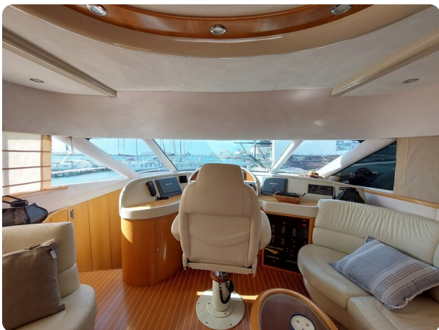
Rodman Yacht 64 Belisa, dedia di guida