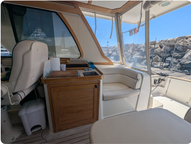
Sabre 42 Express cockpit dinette detail