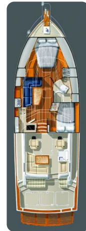
Sabre 42 layout