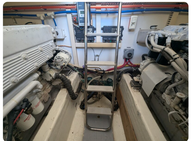
Sabre 42 Express engine room