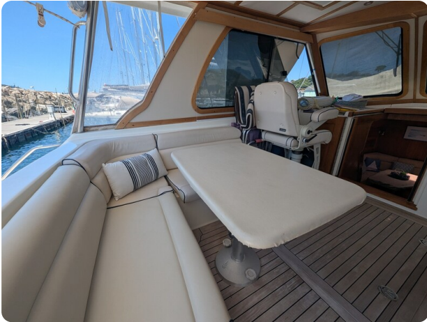
Sabre 42 Express cockpit dinette