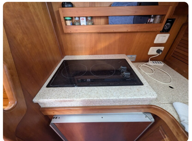
Sabre 42 Express cooktop