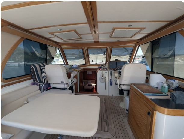
Sabre 42 Express upper cockpit view