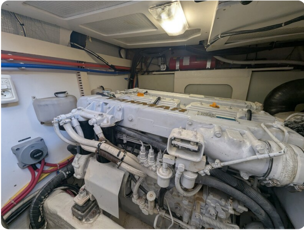
Sabre 42 Express engine detail