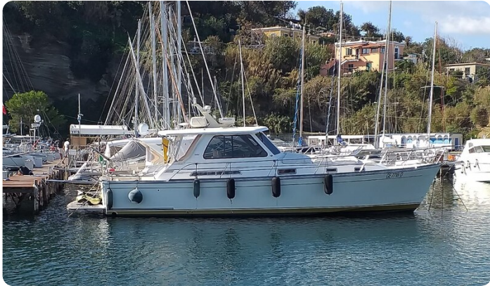
Sabre 42 profile