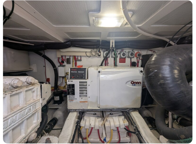
Sabre 42 Express engine room detail