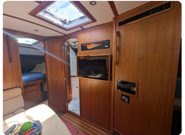
Sabre 42 Express Salon's TV