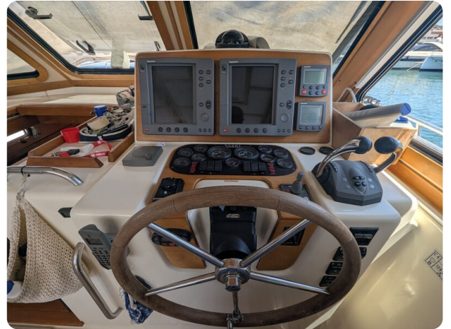
Sabre 42 Express Helm