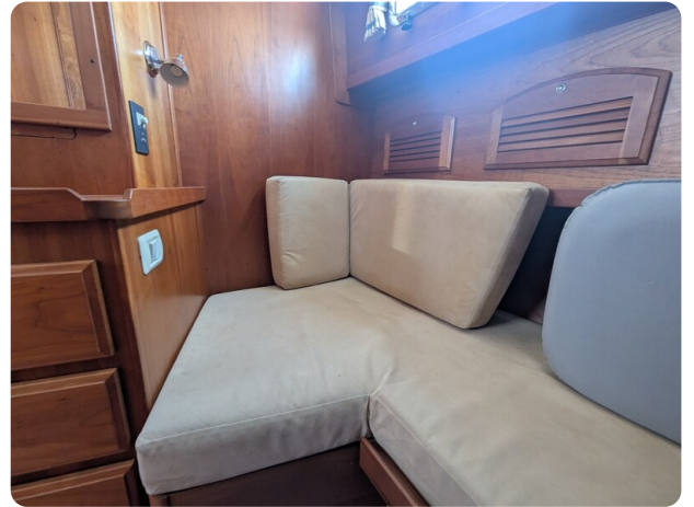
Sabre 42 Express convertible second cabin