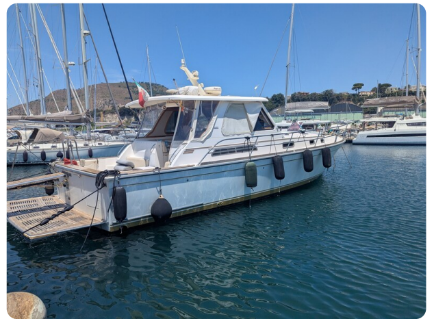
Sabre 42 Express profile