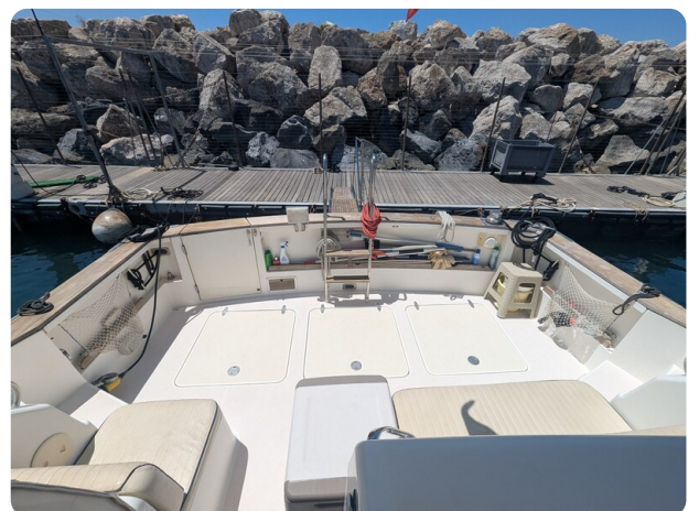
Sabre 42 Express cockpit