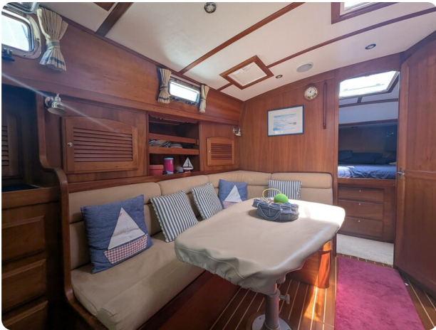
Sabre 42 Express dinette detail