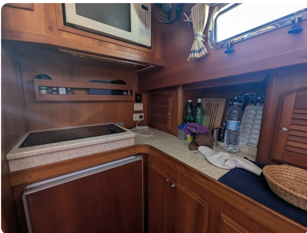
Sabre 42 Express galley