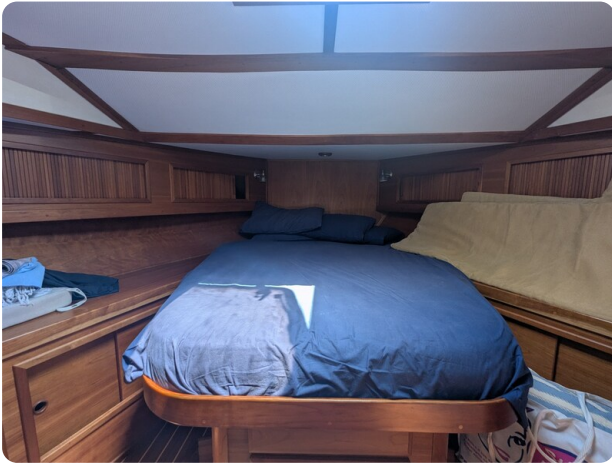
Sabre 42 Express owner's berth