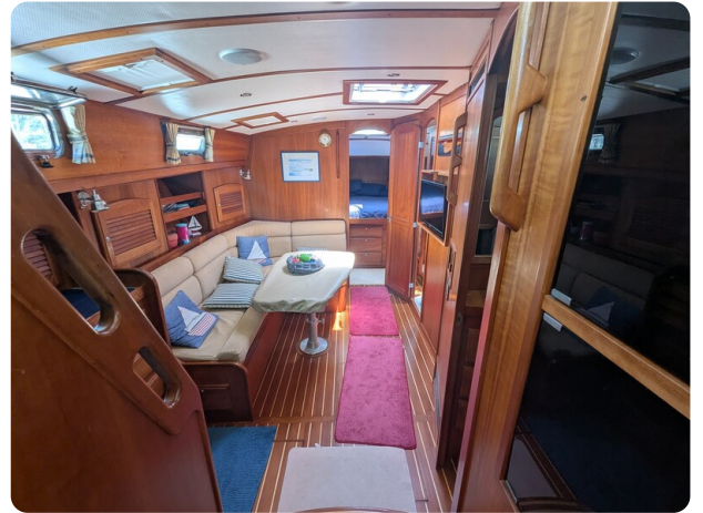
Sabre 42 Express lower dinette