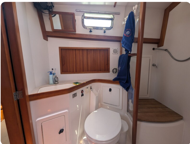
Sabre 42 Express bathroom