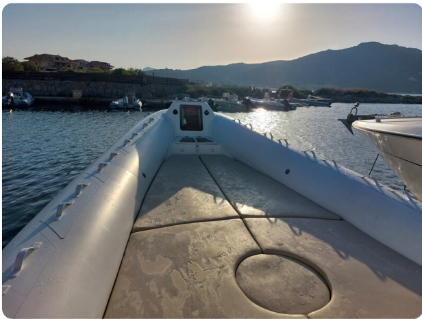
sacs stratos 12 pics 184310