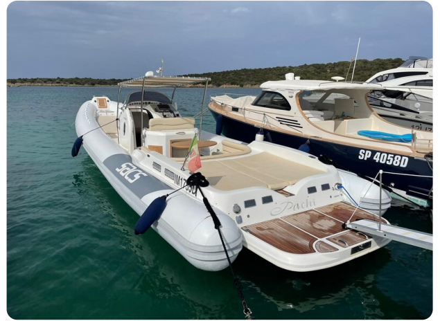
Sacs stratos 12 vista laterale1