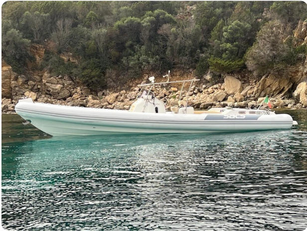
Sacs Stratos 42