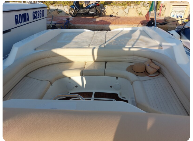
sacs stratos 12 pics 184321