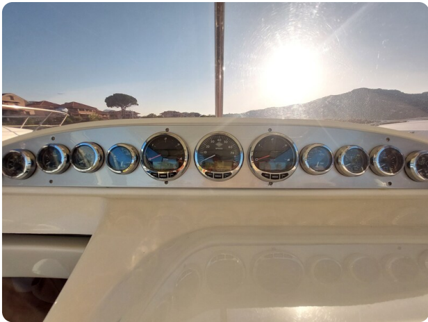
sacs stratos 12 pics 184653