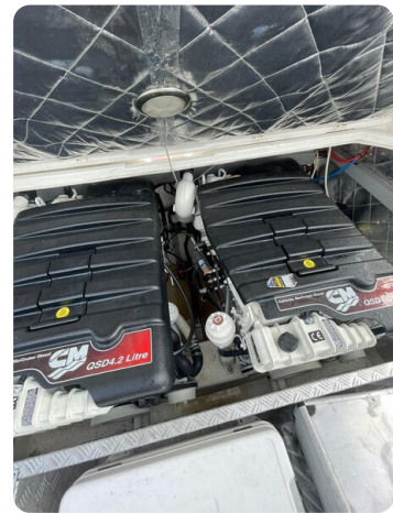
Sacs Stratos 12 engine