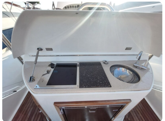
sacs stratos 12 pics 184554