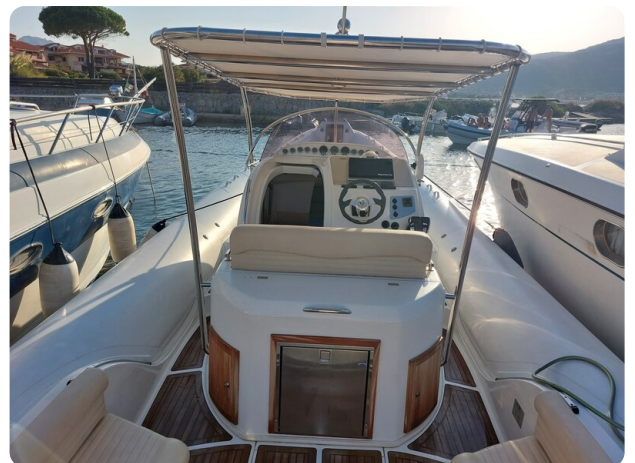
sacs stratos 12 pics 184401