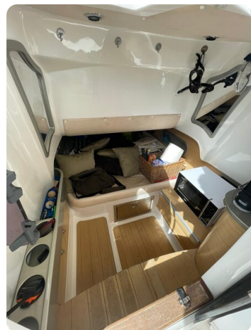
Sacs Stratos 12 interior