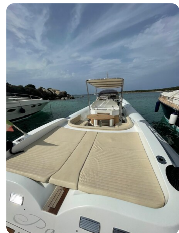
Sacs stratos 12 prendisole