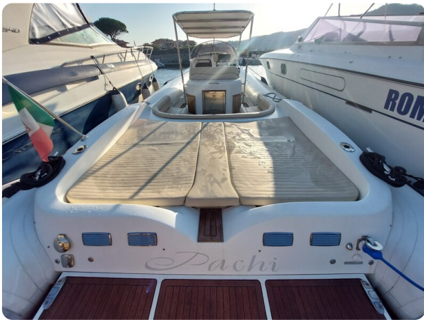
sacs stratos 12 pics 184429