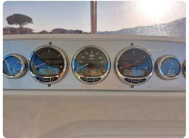
sacs stratos 12 pics 184657