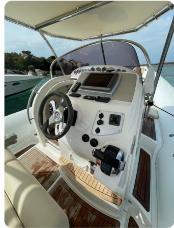
Sacs Stratos 12 prua consolle