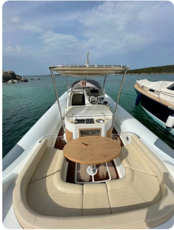
Sacs Stratos 12 Dinette