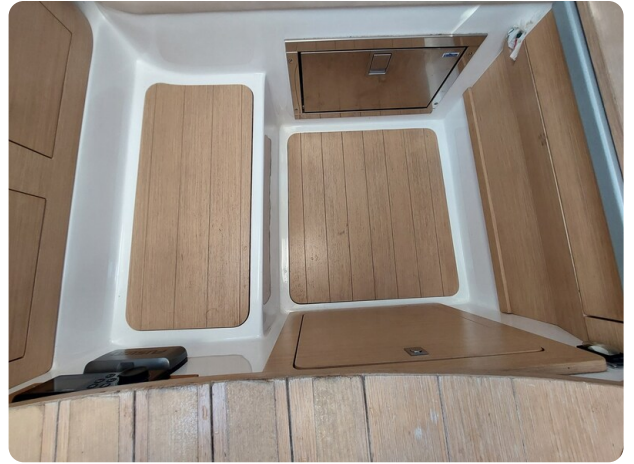
sacs stratos 12 pics 184635