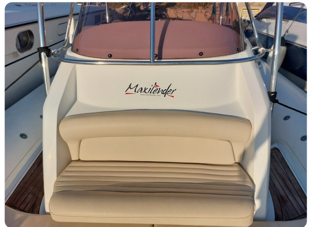
sacs stratos 12 pics 184803