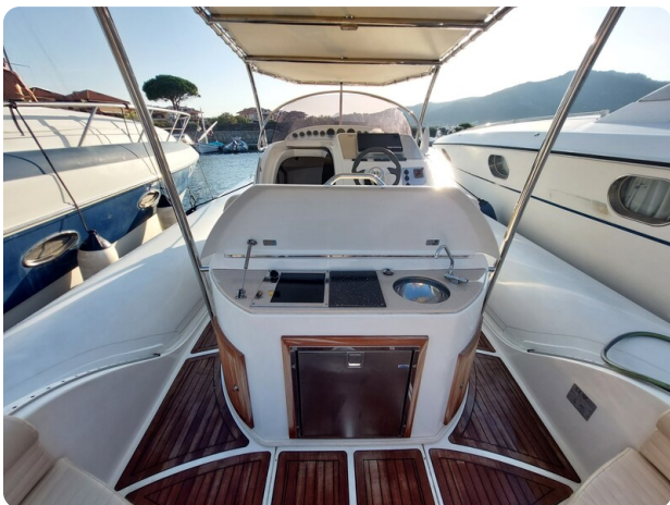
sacs stratos 12 pics 184549