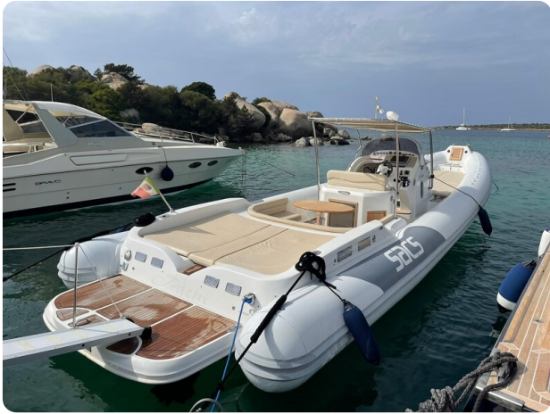
Sacs stratos 12 vista laterale