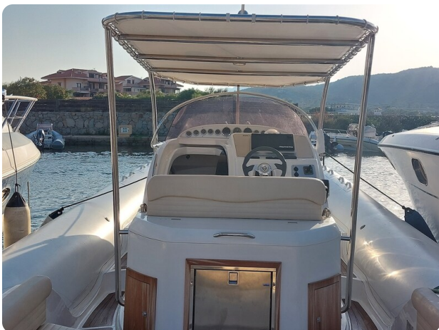
sacs stratos 12 pics 184503