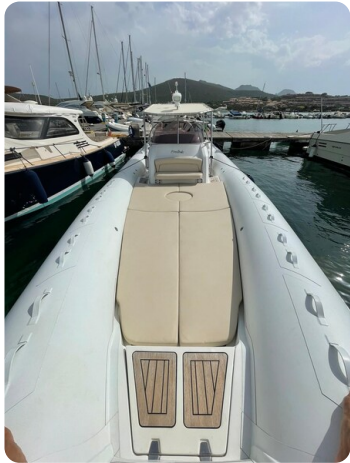
WSacs Stratos 12 prua1