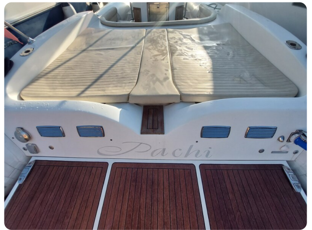
sacs stratos 12 pics 184435