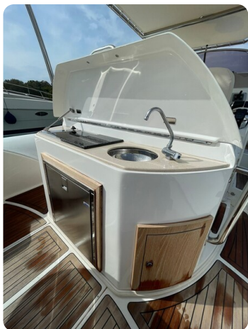
Sacs Stratos 12 galley