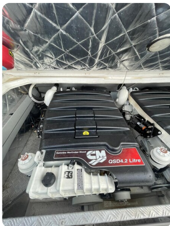
Sacs Stratos 12 engine