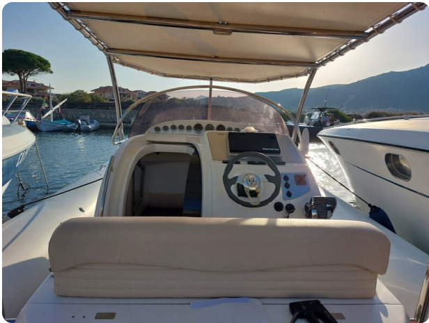
sacs stratos 12 pics 184338