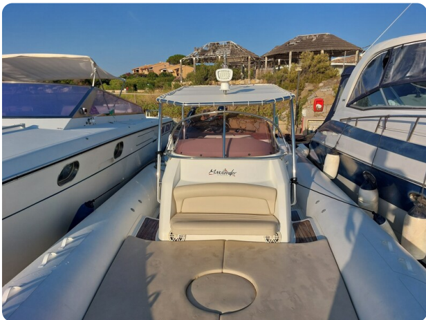
sacs stratos 12 pics 184743