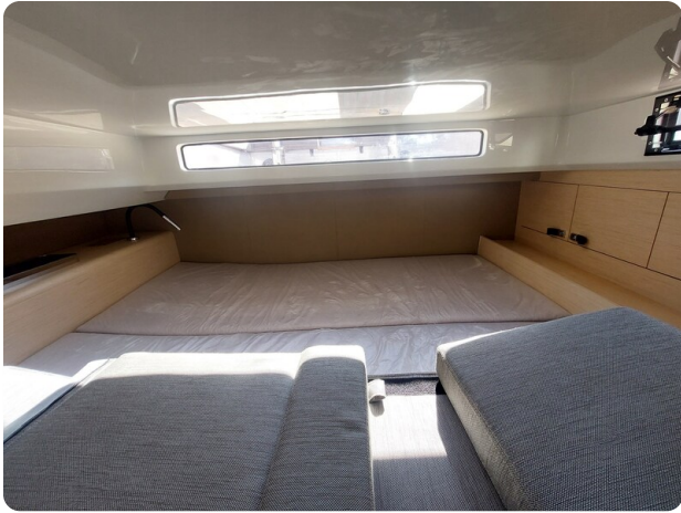
sacs strider 15-54