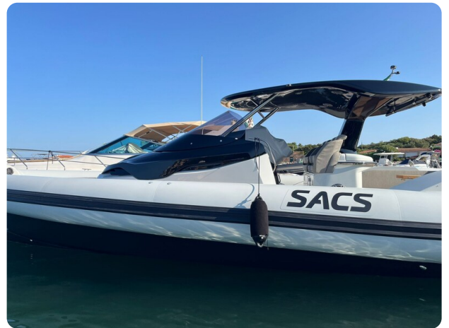
sacs strider 15-36