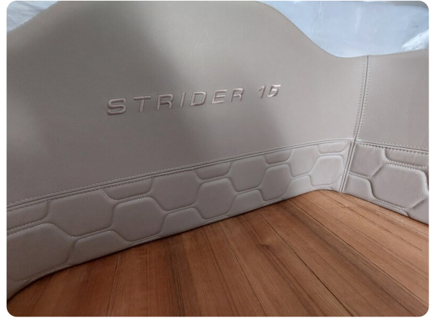
sacs strider 15-55