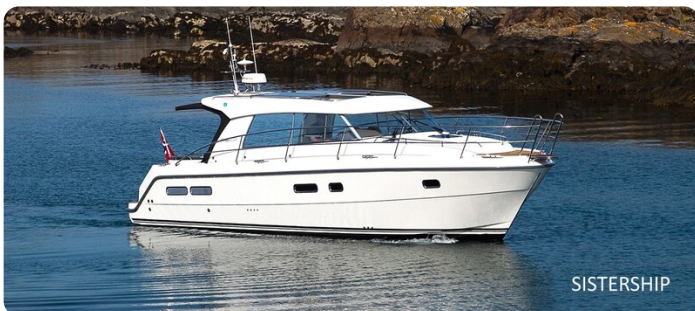
Saga 39 HT sistership