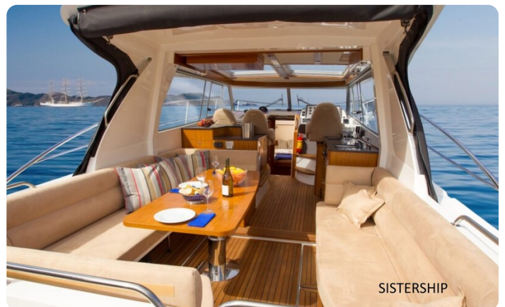
Saga 390 HT Sistership 2.jpg