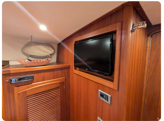
San Juan 48 master cabin Tv