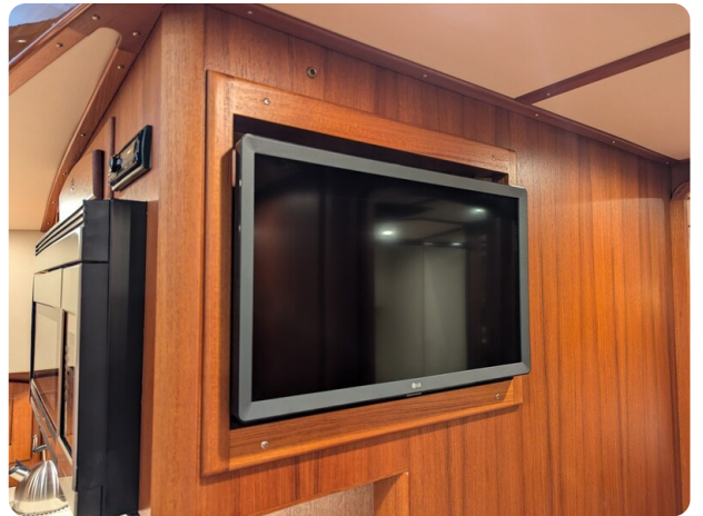
San Juan 48 lower dinette Tv