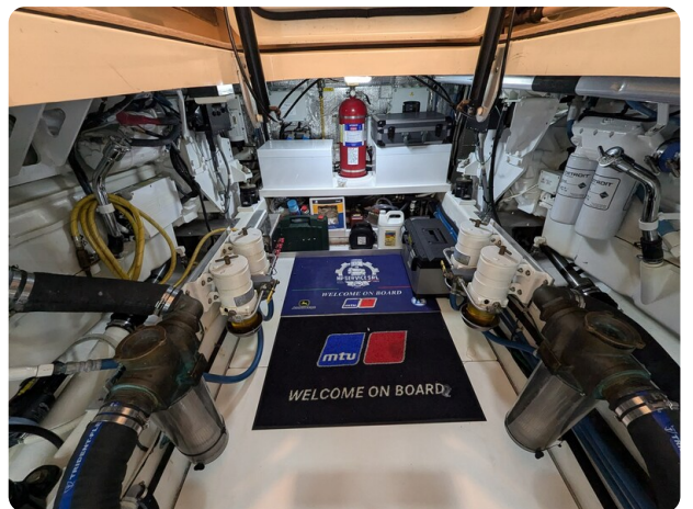
San Juan 48 engine room