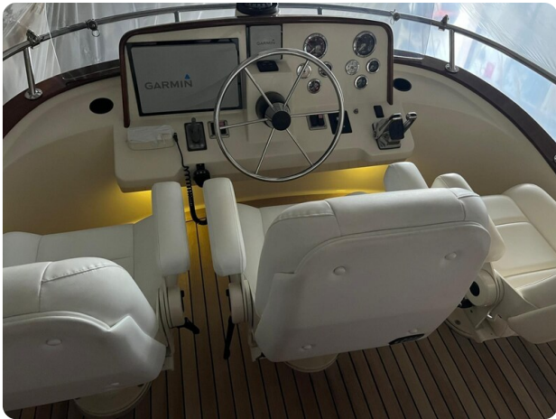
San Juan 40, Fly Helm