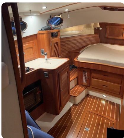
San Juan 40, lower deck