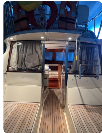
San Juan 40, cockpit view