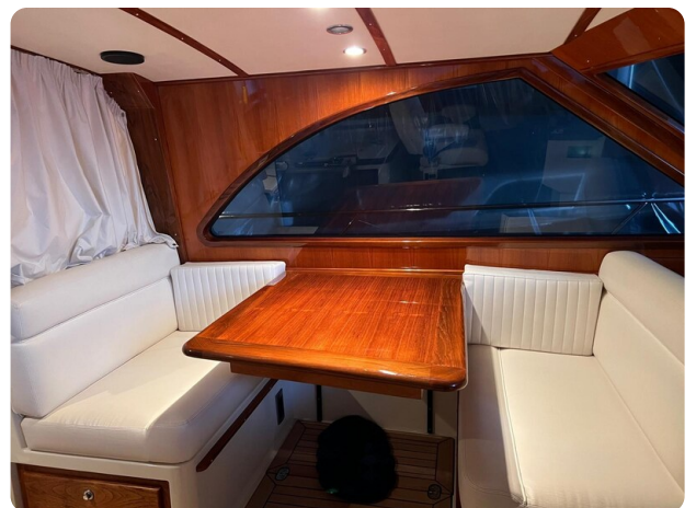
San Juan 40, dinette