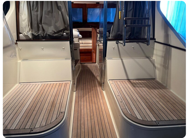
San Juan 40, cockpit