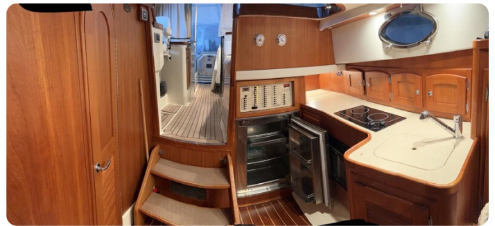
San Juan 40, galley