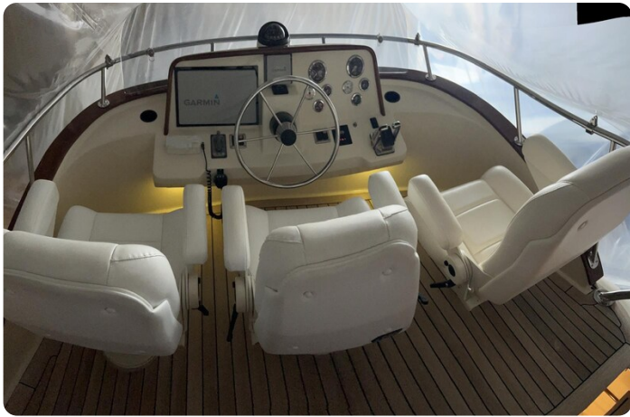
San Juan 40 Fly helm view