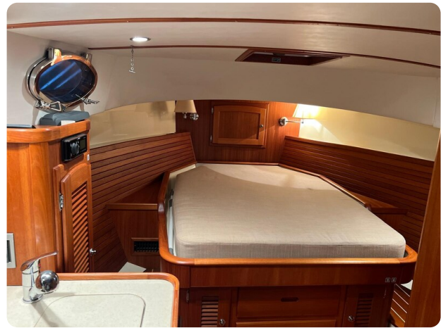
San Juan 4, berth0