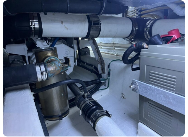
San Juan 40, engine room detail 2