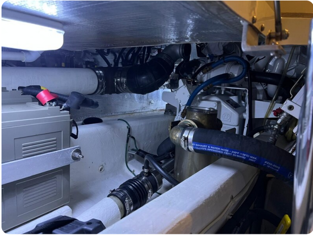
San Juan 40, engine room detail 1