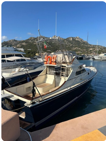
SAN JUAN 40 FLY aft profile