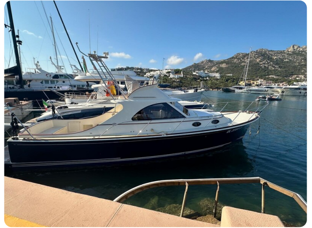
SAN JUAN 40 FLY profile