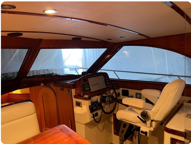
San Juan 40, helm station