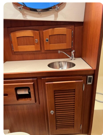
San Juan 40 bathroom