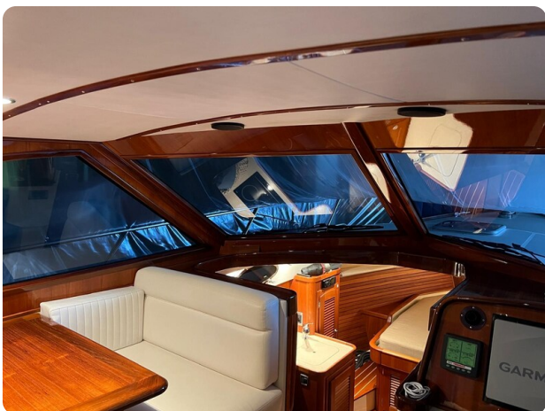
San Juan 40, interiors