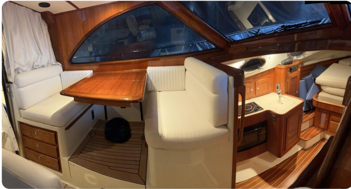
San Juan 40, dinette and galley