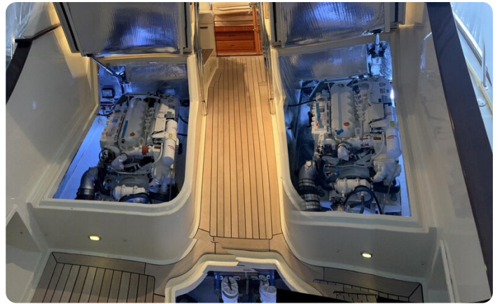
San Juan 40, engine room view