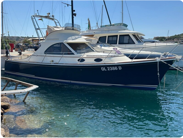
SAN JUAN 40 FWD PROFILE