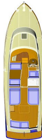
SAN JUAN 40 LAYOUT