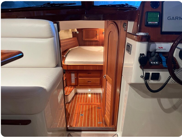
San Juan 40, lower deck access