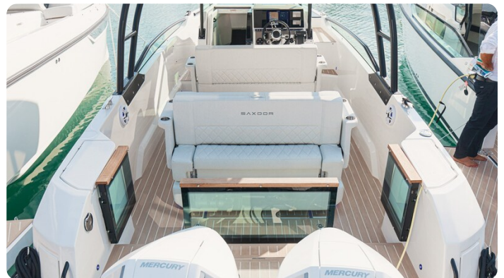
SAXDOR 270 GTO Stern