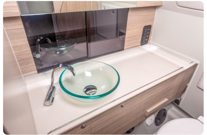
Saxdor 320 GTC bathroom