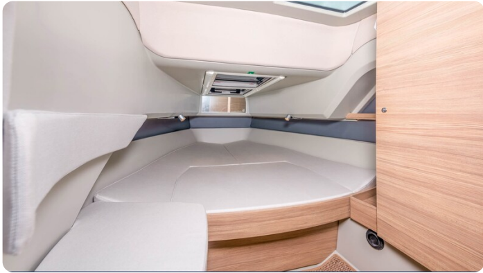
Saxdor 320 GTC cabin