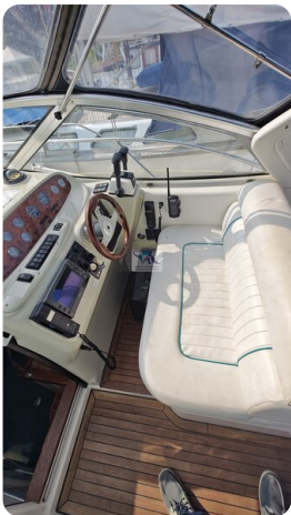
Sealine 28 Sport 27