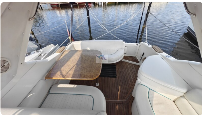
Sealine 28 Sport 16