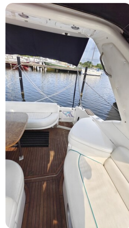
Sealine 28 Sport 17