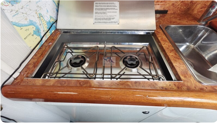
Sealine 28 Sport 32