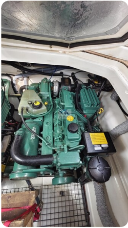
Sealine 28 Sport 65