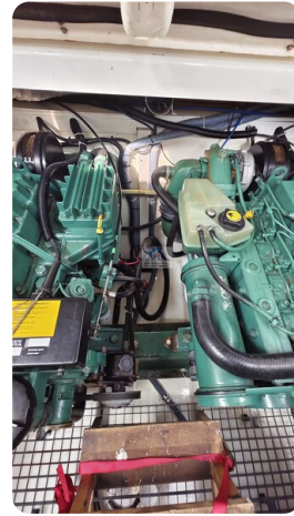
Sealine 28 Sport 67