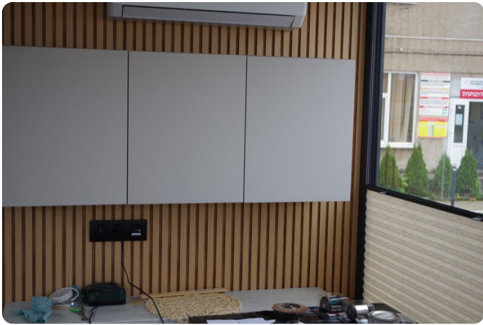
Shogun Hausboot 10m 57