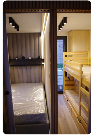
Shogun Hausboot 10m 6