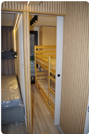
Shogun Hausboot 10m 9