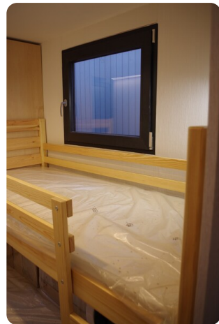
Shogun Hausboot 10m 14