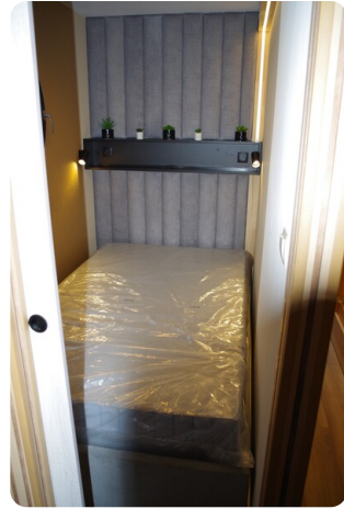
Shogun Hausboot 10m 1