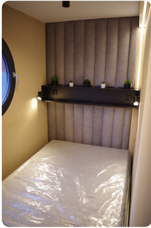
Shogun Hausboot 10m 3