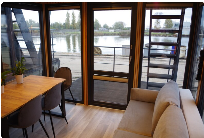
Shogun Hausboot 1000 17