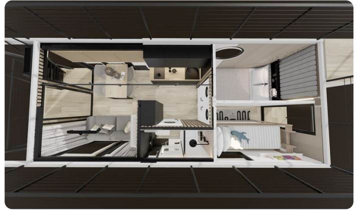
Shogun Hausboot 1000 Layout