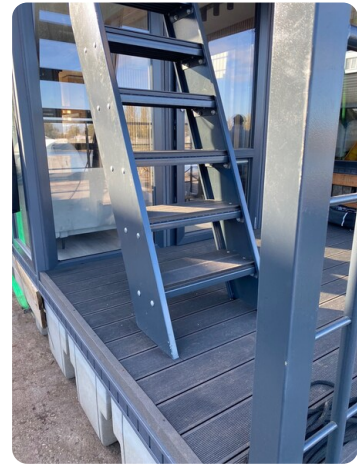
Shogun Hausboot 1000 3