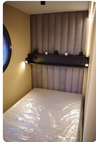
Shogun Hausboot 1000 7