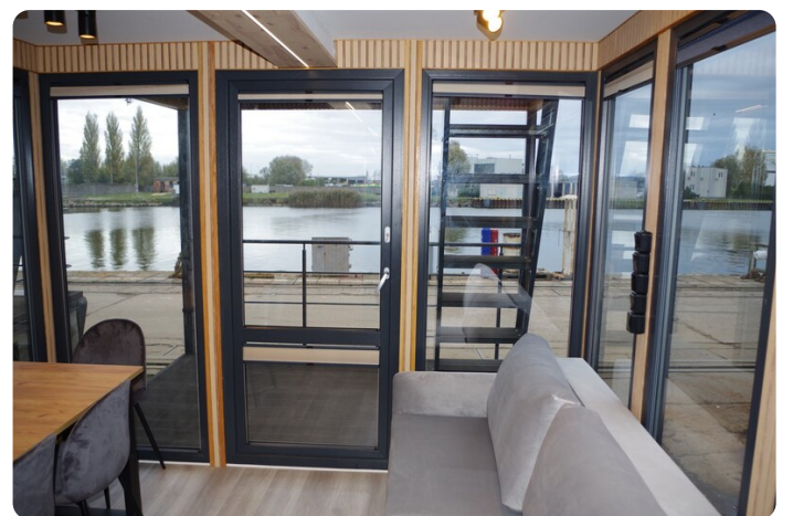
Shogun Hausboot 1000 5