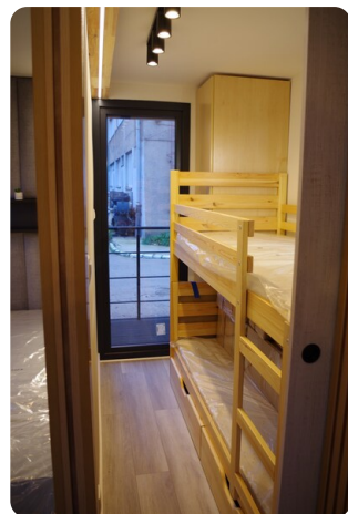
Shogun Hausboot 1000 11