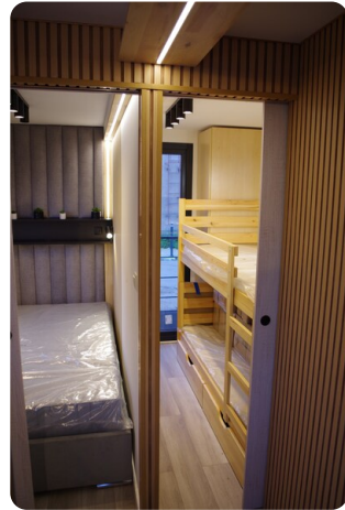
Shogun Hausboot 1000 9