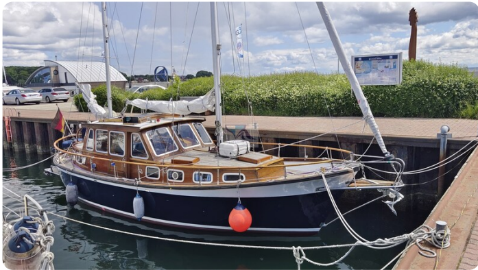
Nauticat 33 NORDSTRAND 2