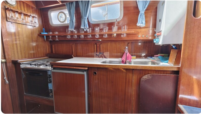
Nauticat 33 NORDSTRAND 47