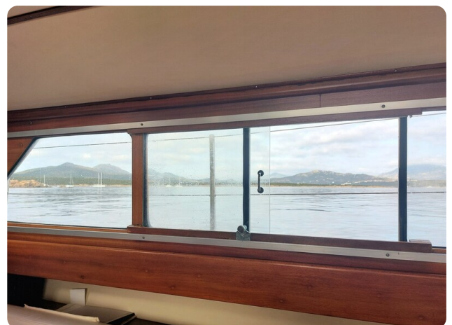
Storebro wide side windows