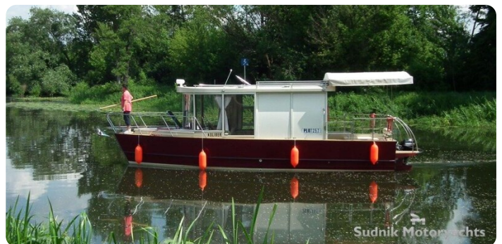
Hausboot SM 30 msp-398859 (22)