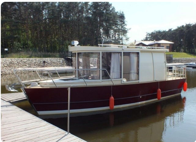
Hausboot SM 30 msp-398859 (23)