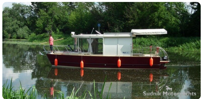
Hausboot SM 30 msp-398859 (22)