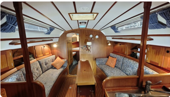
Sweden 340 SPITZMAUS 2