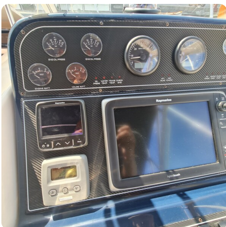
Tiara 2900 Coronet Helm detail