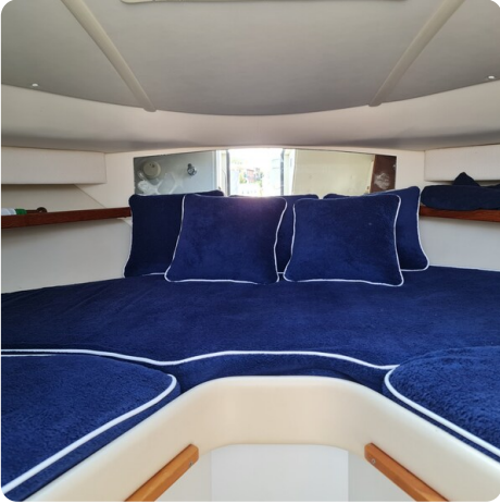
Tiara 2900 Coronet cabin's berth