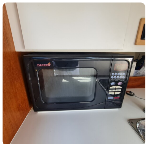
Tiara 2900 Coronet microwave combi