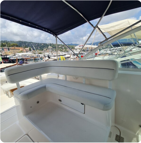
Tiara 2900 Coronet cockpit lounge