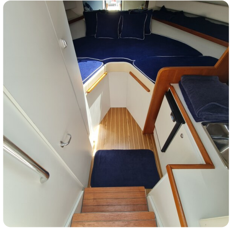
Tiara 2900 Coronet cabin