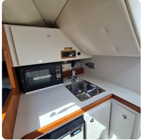
Tiara 2900 Coronet galley