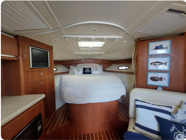
Tiara 3200 Open interiors