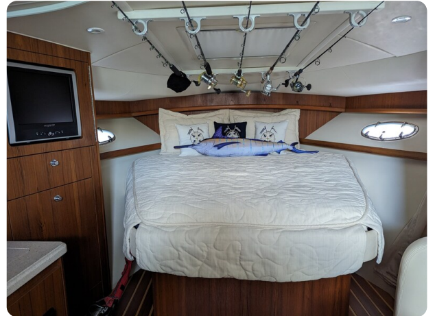
Tiara 3200 Open master berth