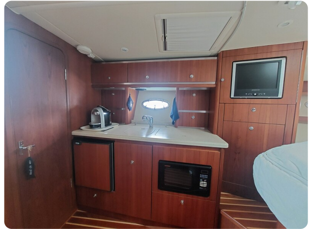
Tiara 3200 Open galley