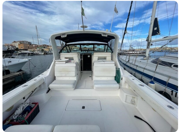
Tiara 3500 Open cockpit.jpg