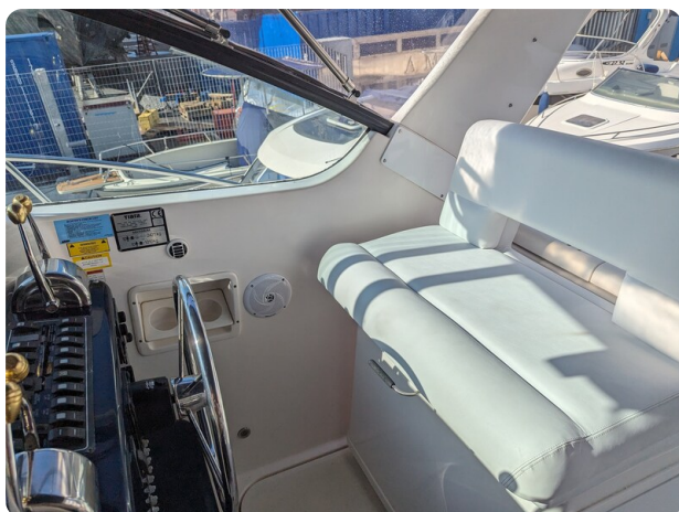
Tiara 3500 Open pilot seat