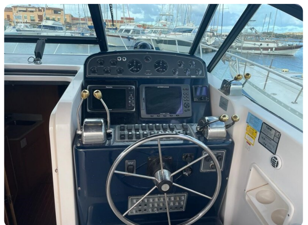
Tiara 3500 Open helm.jpg