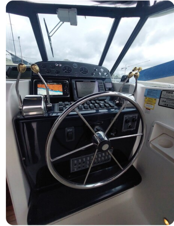
Tiara 3500 Open Sampei helm station