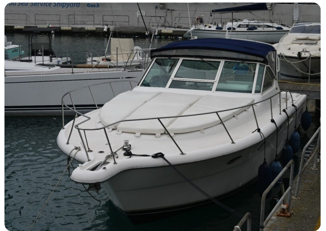
Tiara 3500 Open Sampei bow view