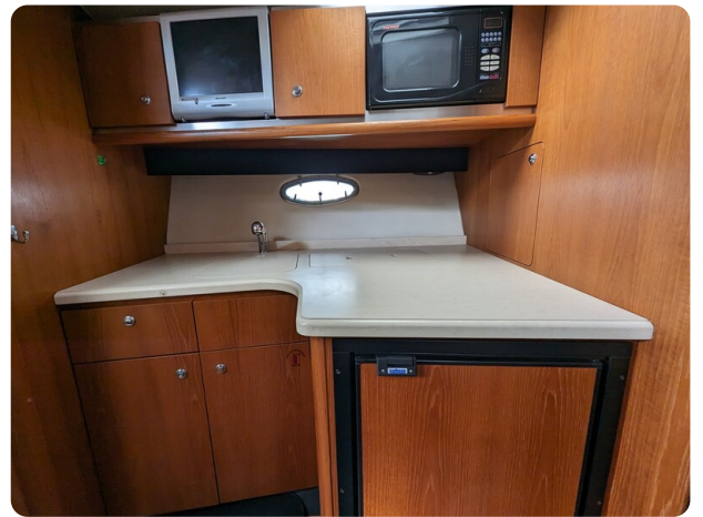
Tiara 3600 Open galley