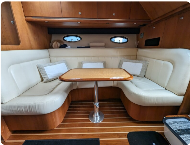
Tiara 3600 Open dinette