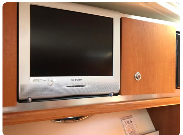
Tiara 3600 Open Tv