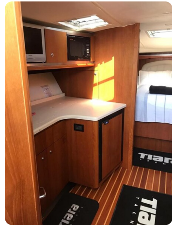
Tiara 3600 Open galley