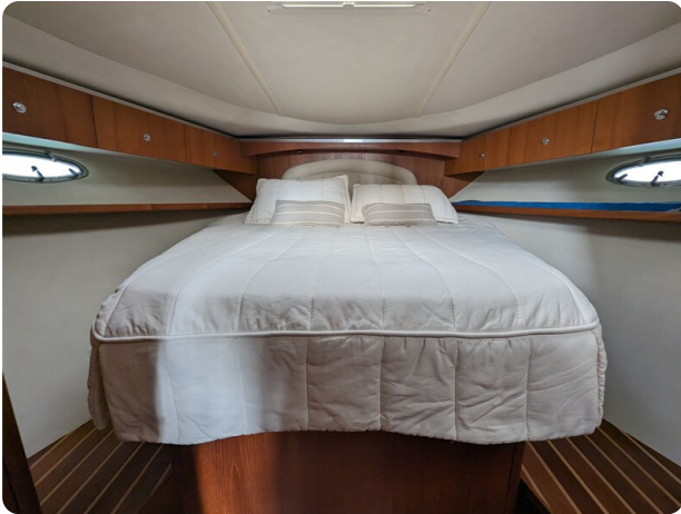
Tiara 3600 Open master cabin