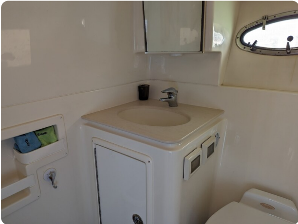
Tiara 3600 Open bathroom