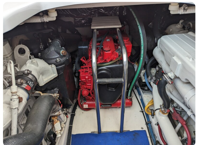
Tiara 3600 Open generator