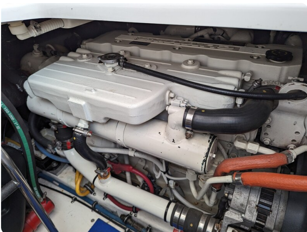
Tiara 3600 Open engine detail