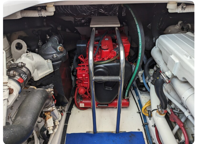
Tiara 3600 Open engine room