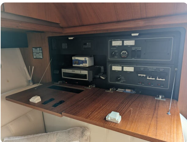
Tiara 3600 Open electrical panel