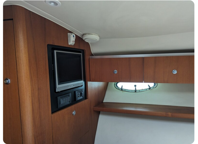
Tiara 3600 Open master cabin's TV