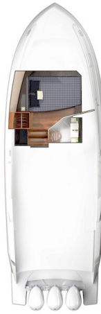
Tiara 38 LS lower layout