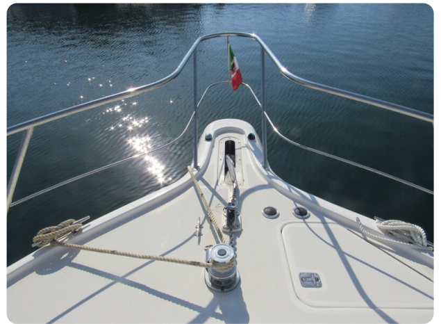
Tiara 3800 Open, bow pulpit