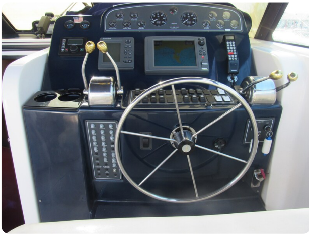
Tiara 3800 Open, helm