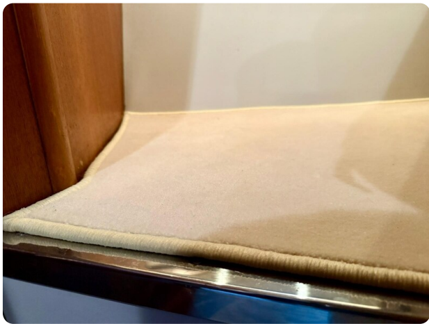
Tiara 3800 Open New Moquette