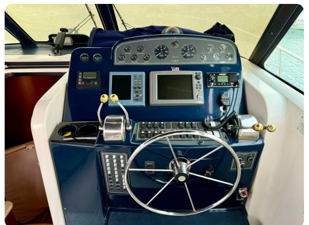
Tiara 3800 Open Helm Station