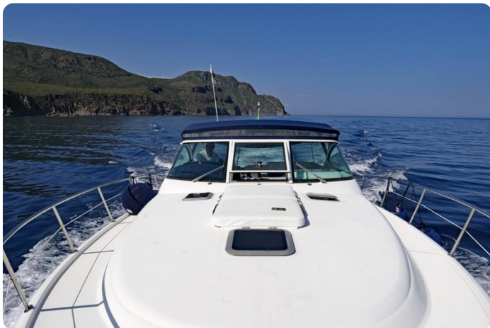
Tiara 3800 Open Bow