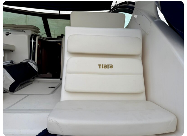
Tiara 3800 Open Cockpit Aft Seat