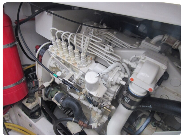
Tiara 3800 Open engine room