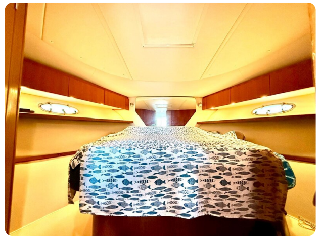
Tiara 3800 Open Cabin