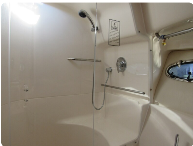
Tiara 3800 Open shower stall