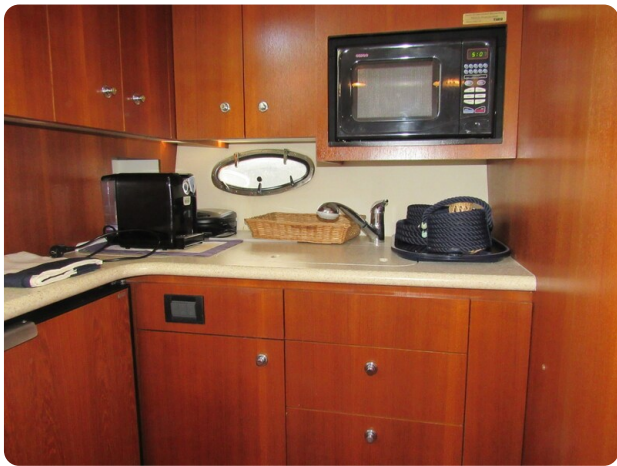
Tiara 3800 Open galley