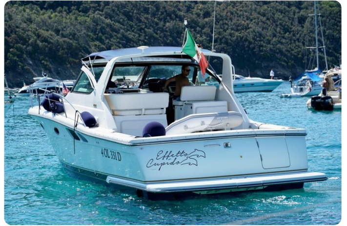
Tiara 3800 Open Stern