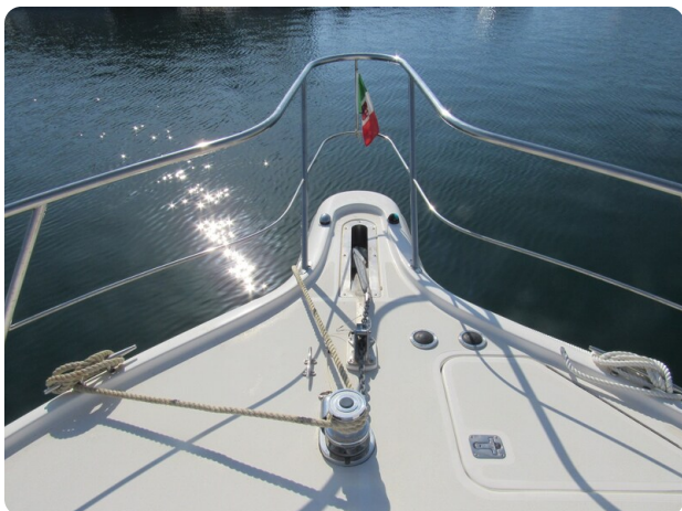
Tiara 3800 Open, bow pulpit