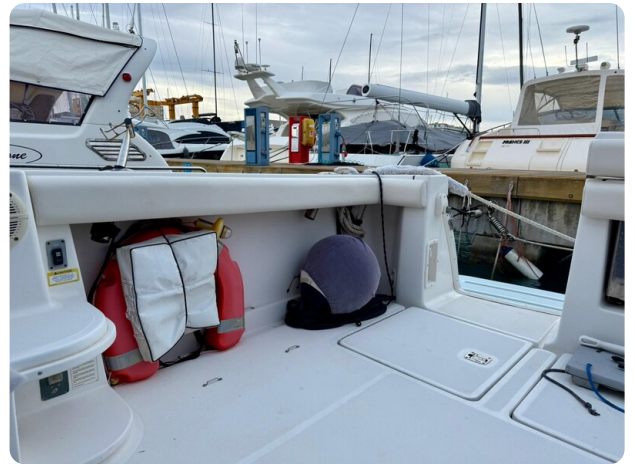
Tiara 3800 Open Aft Detail