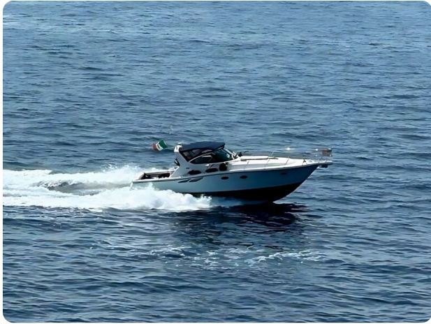
Tiara 3800 Open Cruising