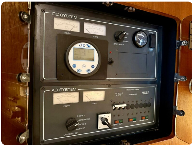
Tiara 3800 Open New Electrical Panel