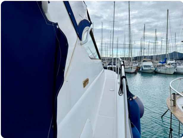
Tiara 3800 Open Sideway