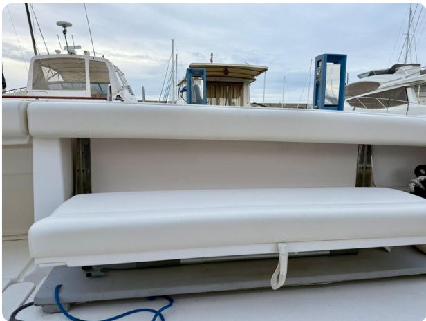
Tiara 3800 Open Aft Seats