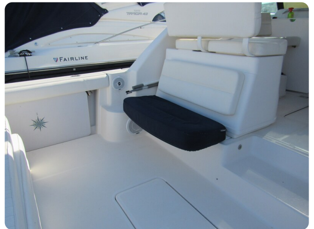
Tiara 3800 Open cockpit aft seat