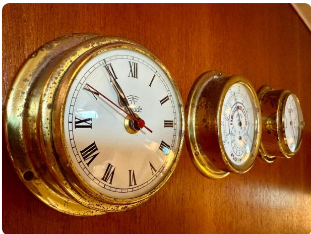
Tiara 3800 Open Detail