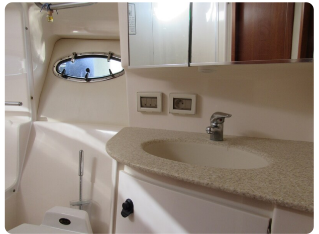
Tiara 3800 Open bathroom