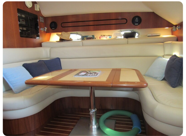
Tiara 3800 Open dinette