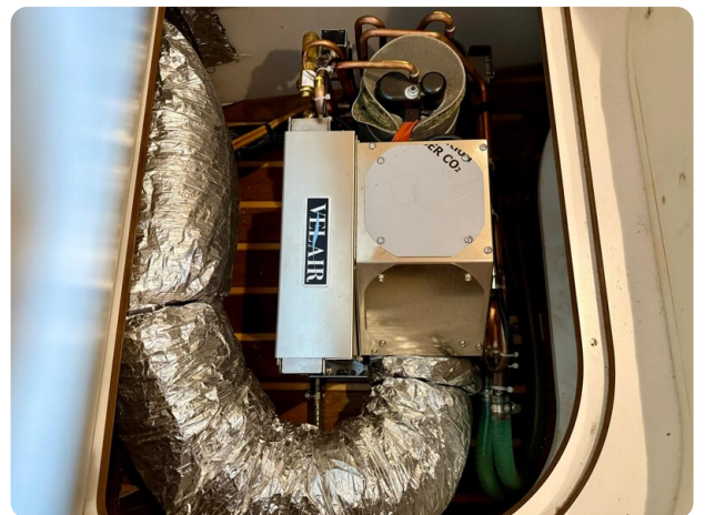
Tiara3800 Open New AC