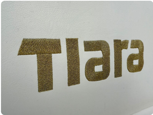
Tiara 3800 Open New Logo Detail