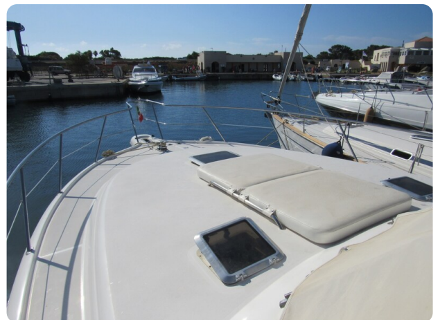
Tiara 3800 Open Bow Sunpad