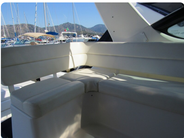
Tiara 3800 Open cockpit lounge