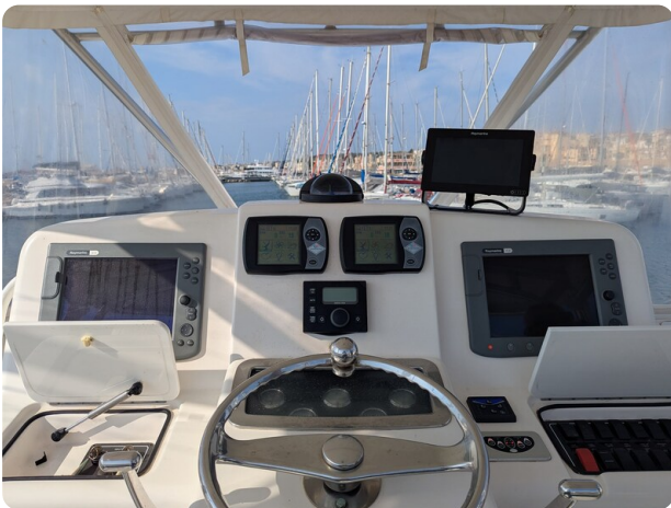
Tiara 3900 Conv. Helm station