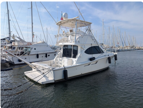
Tiara 3900 Conv. profile