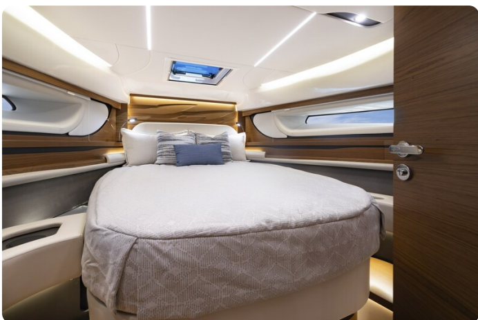
{1} Master cabin