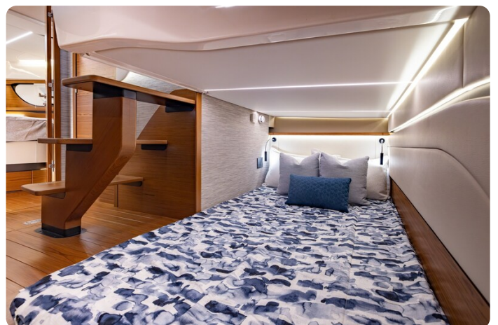
{1} Aft berth