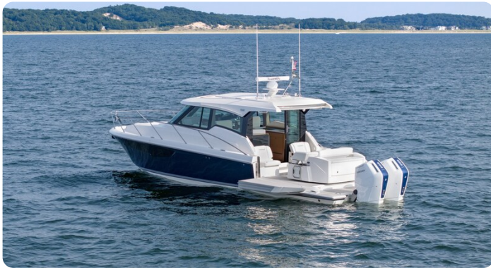
43 LE Nav