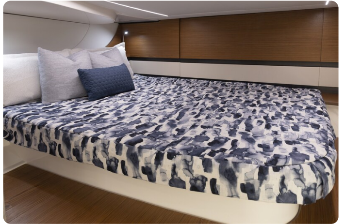
{1} Guest cabin