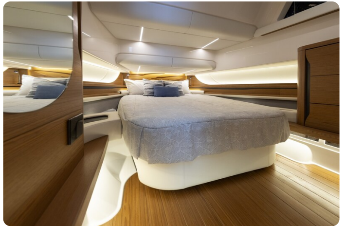
{1} Owner's cabin