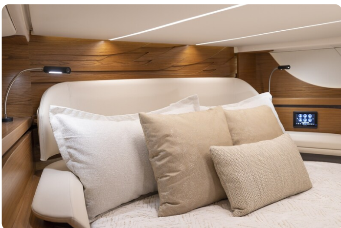
Tiara 56LS owner's cabin detail