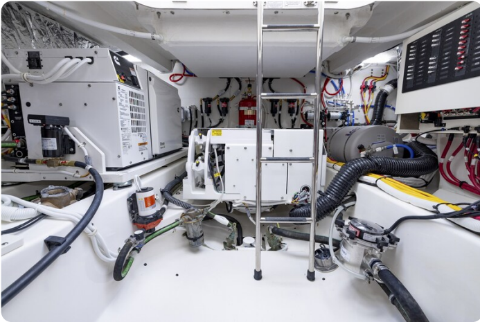
Tiara 56LS technical room