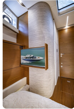
Tiara 56LS owner's cabin tv