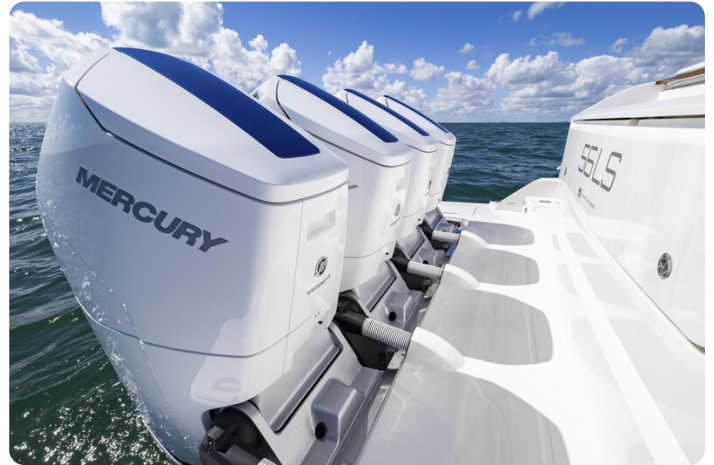
Tiara 56LS engines detail