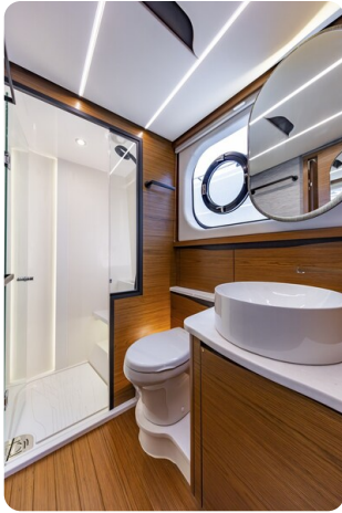
Tiara 56LS owner's bathroom