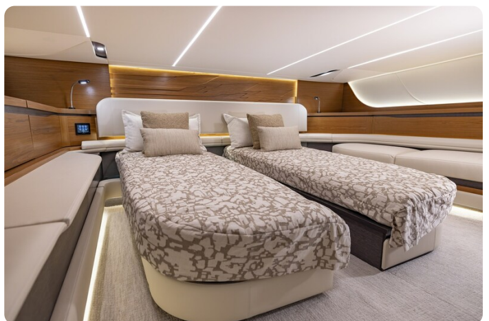
Tiara 56LS guest berth convertible in twin