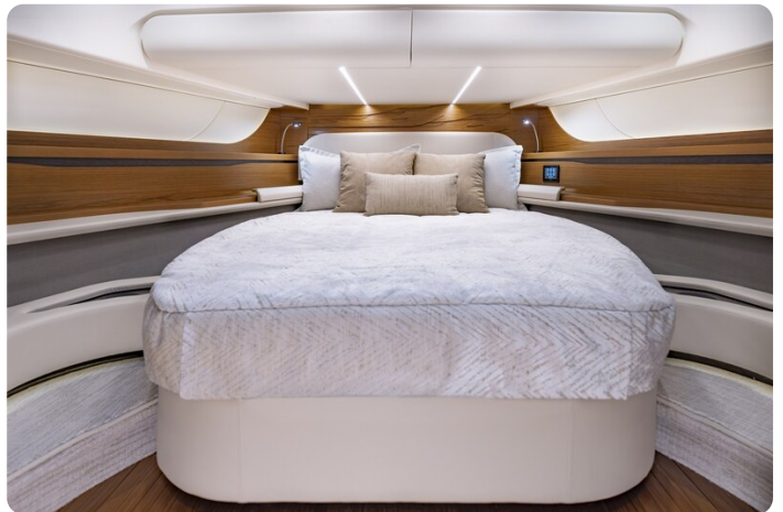
Tiara 56LS owner's cabin