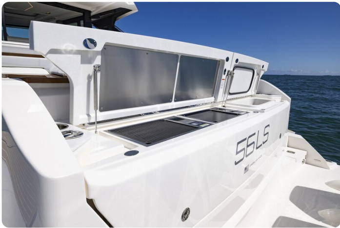
Tiara 56LS transom detail