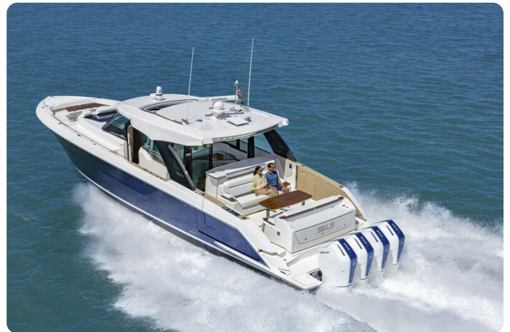
Tiara 56LS running