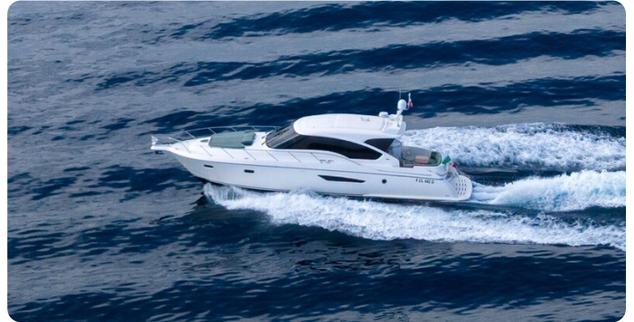
Tiara 5800 Sovran running