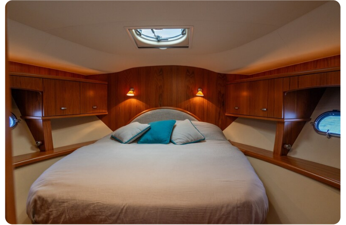
{1} Vip cabin