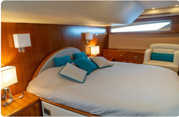
{1} Owner's cabin