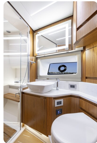
Tiara EX54 bathroom