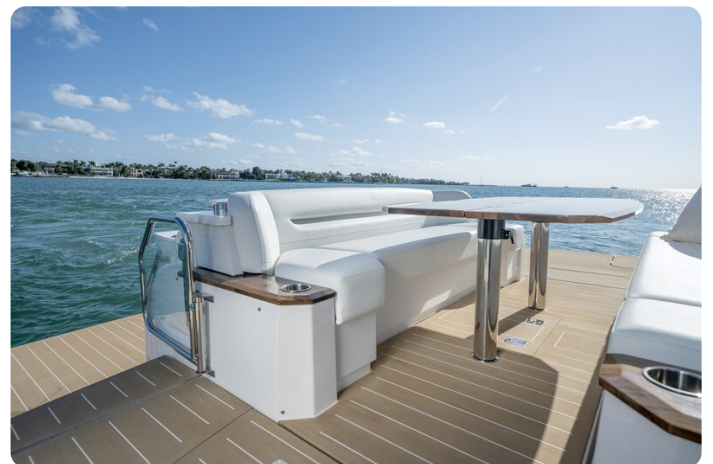
Tiara EX60 aft lounge