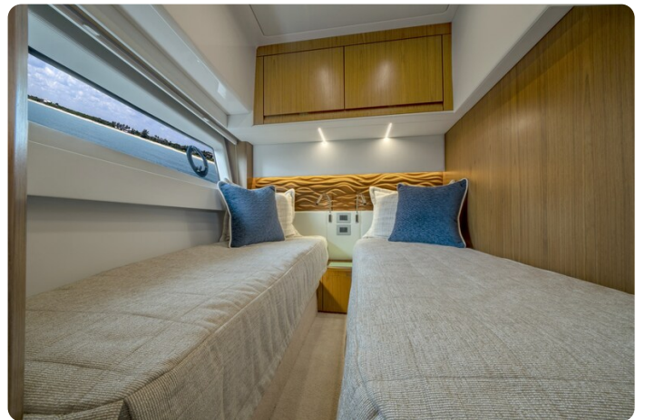
Tiara EX60 guest cabin