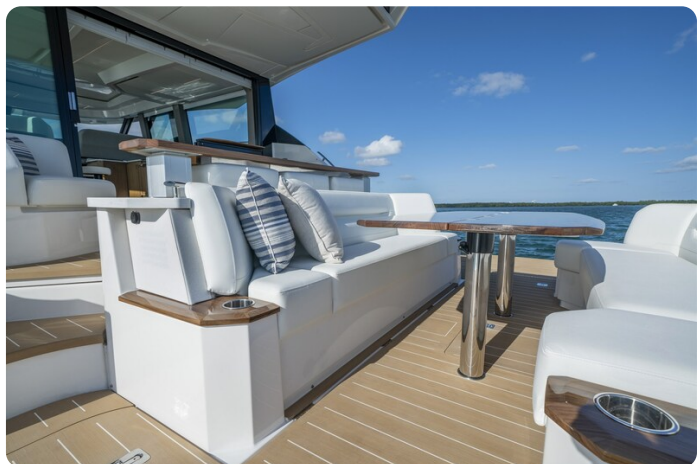
Tiara EX60 cockpit dinette