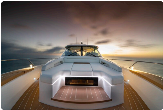
Tiara EX60 bow detail