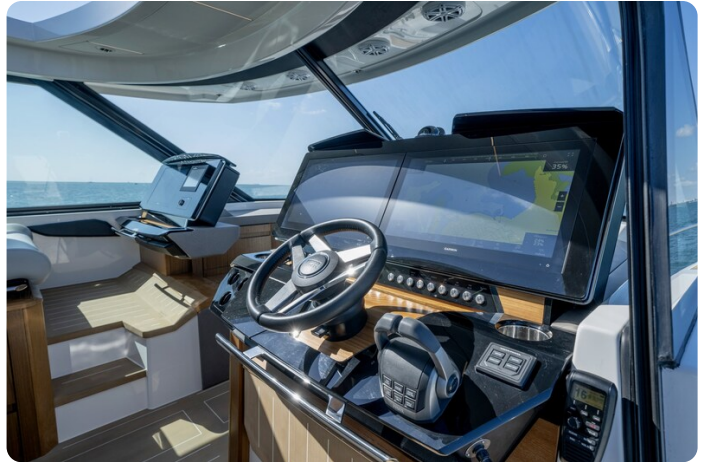
Tiara EX60 helm