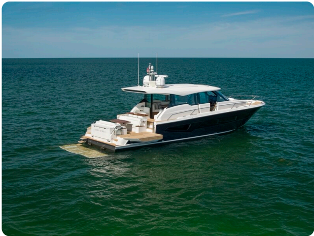
Tiara EX60 aft profile