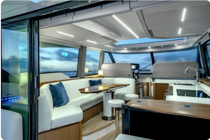
Tiara EX60 salon view