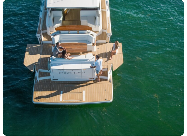
Tiara EX60 terraces