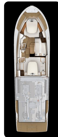
Tiara EX 60 lower layout