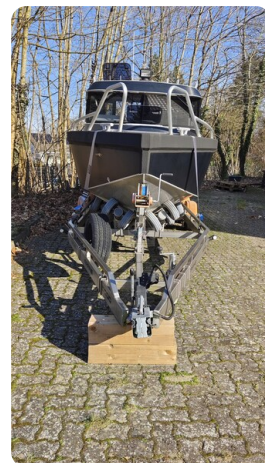
Voyager 700 Cabin_21