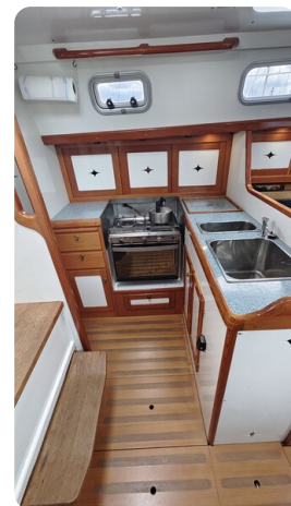
Helena 35 21