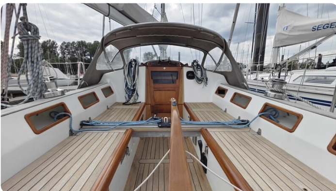
Helena 35 38