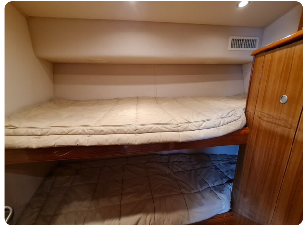
Viking 45 Open, guest cabin