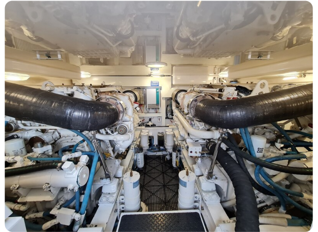
Viking 45 Open, engine room