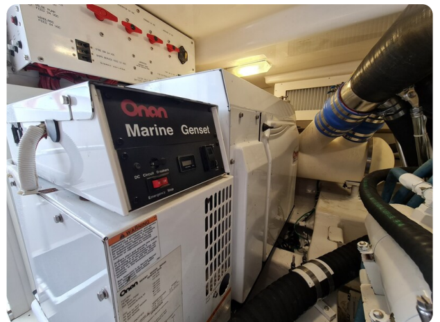
Viking 45 Open, generator