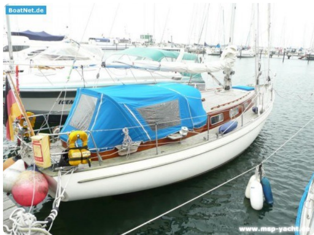
Vindö 50 msp269542 1