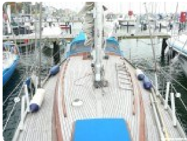
Vindö 50 msp269542 2