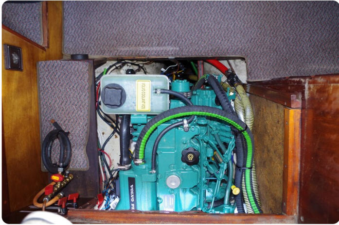
Vindö 50 msp269542 18