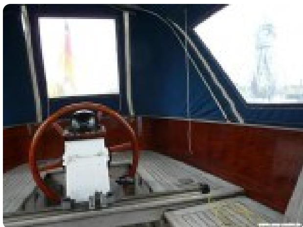
Vindö 50 msp269542 4