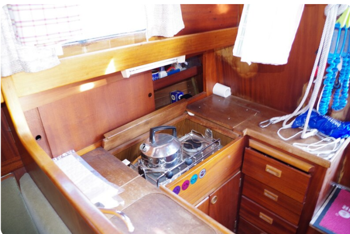
Vindö 50 msp269542 16