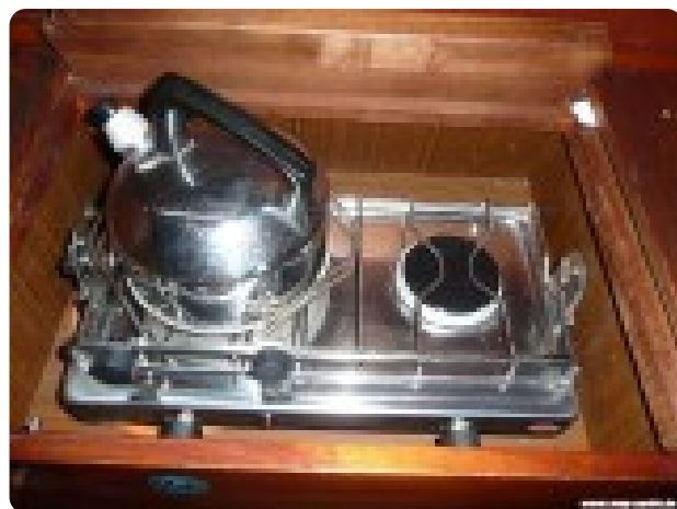
Vindö 50 msp269542 5