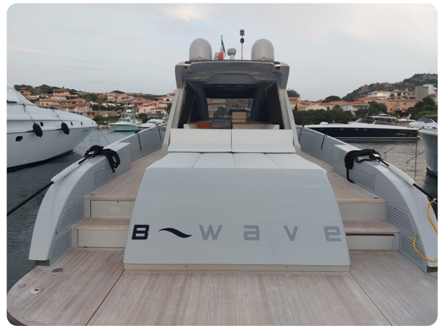
Vismara Bwave profile (1)