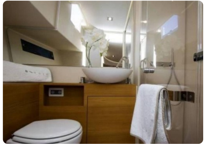
Vismara B Wave wc