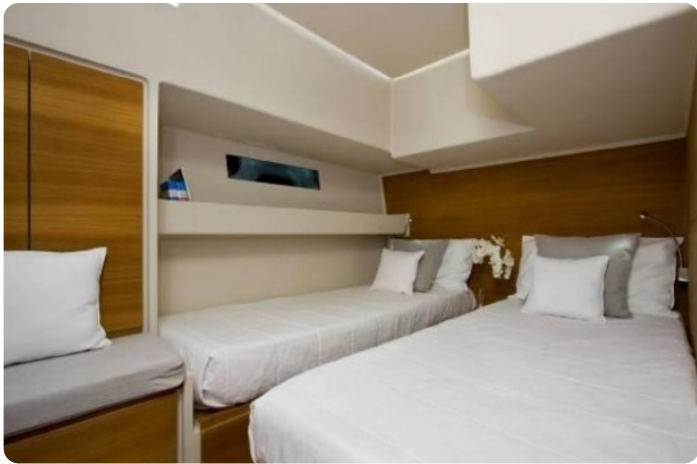
Vismara B Wave vip cabin