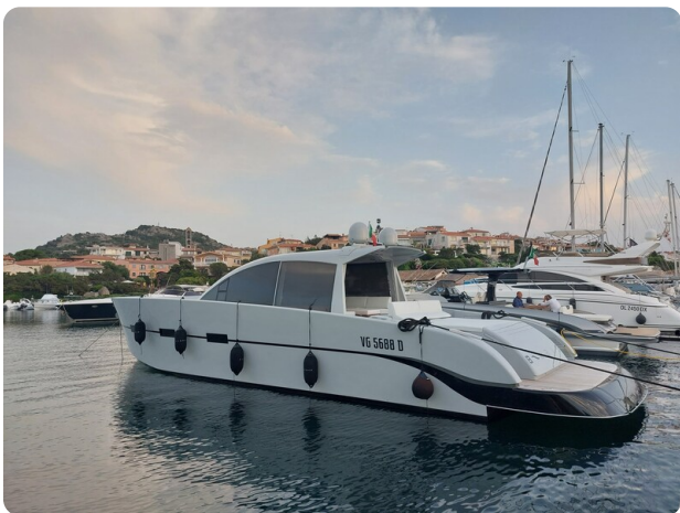
Vismara Bwave profile1