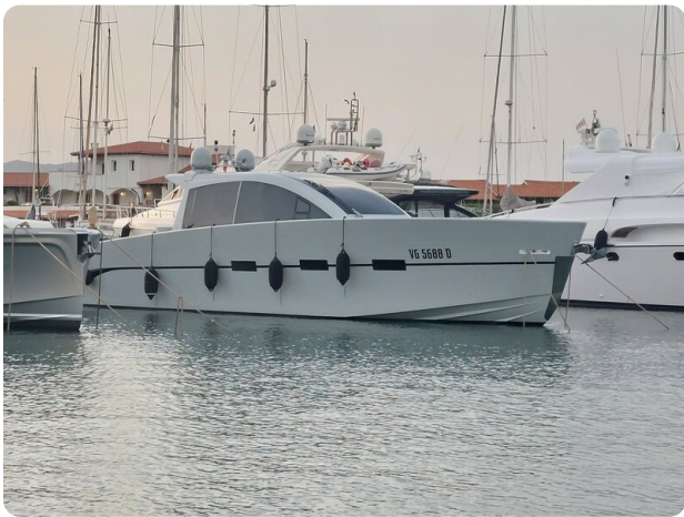
Vismara Bwave profile