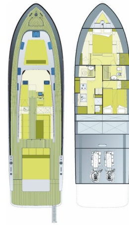
Vismara B wave layout