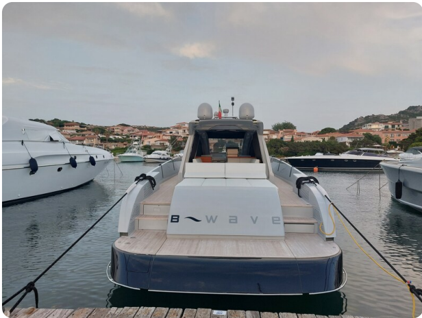
Vismara Bwave aft profile