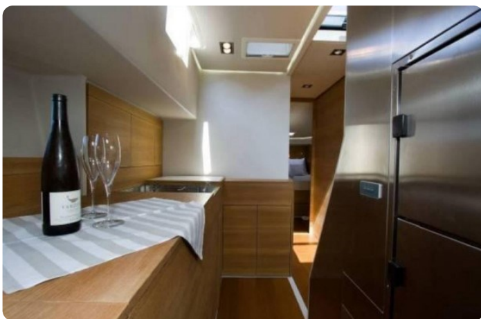
Vismara B Wave galley