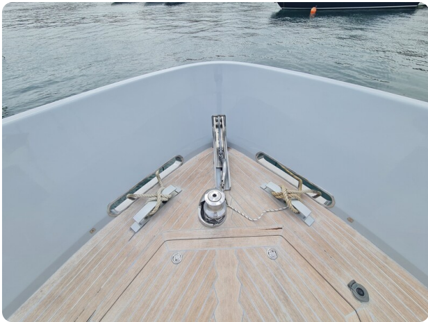
Vismara B-wave detail