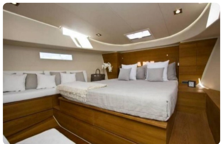
Vismara B Wave master cabin