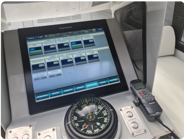
Vismara Bwave (1)