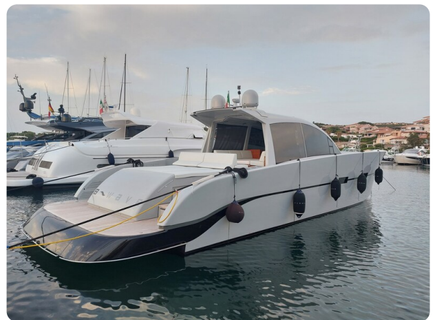
Vismara Bwave profile3