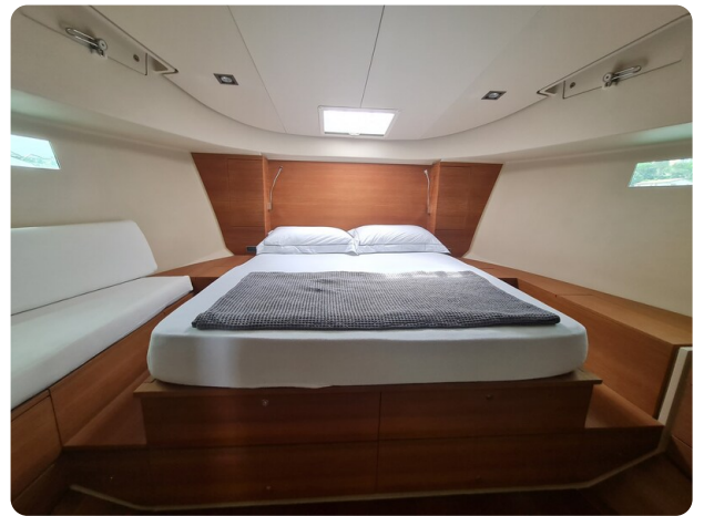
Vismara Bwave master cabine