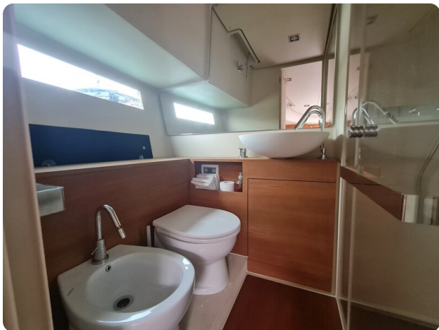
Vismara Bwave (2)