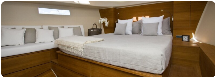
Vismara B Wave interni