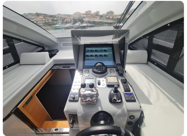
Vismara Bwave helm