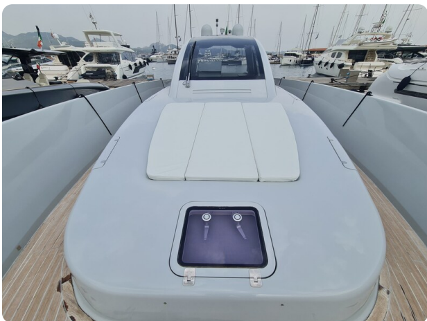
Vismara B wave prua