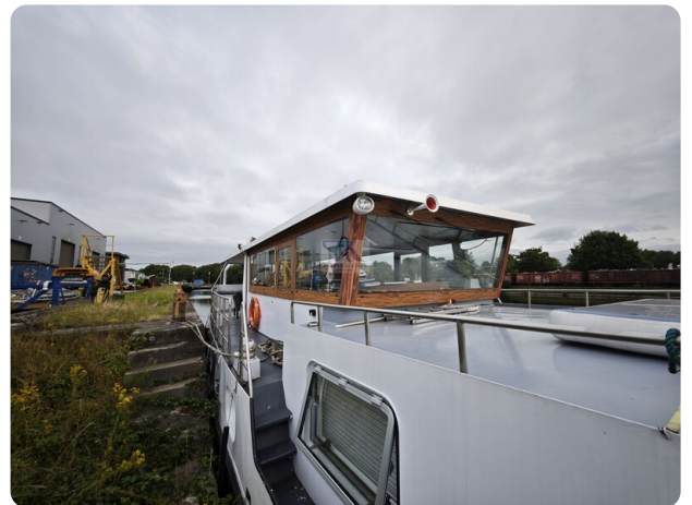
MY GINO 18