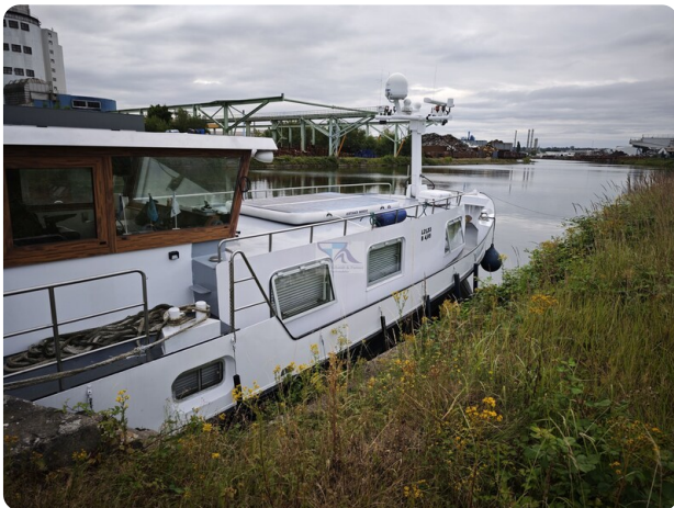
MY GINO 2